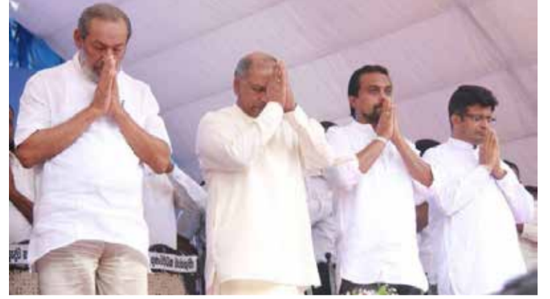
இவ்வாறானதொரு பின்புலத்திலேயே மக்கள் மத்

இதற்காக எதிர்வரும் 29 ஆம் திகதி 'மக்கள் சபை' எனும் தொனிப்பொருளின்கீழ் பகிரங்க கூட்டமொன்றை நடத்துவதற்கு மொட்டு அரசுக்கு ஆதரவு வழங்கும் 10 பங்காளிக்கட்சிகள் தயாராகி வருகின்றன. யுகதனவி விவகாரம் தொடர்பில் கலந்துரையாடுவதற்கு நேரம் வழங்குமாறு ஜனாதிபதியிடம், பங்காளிக்கட்சிகளின் தலைவர்கள் கோரிக்கை விடுத்திருந்தாலும் அதனை ஜனாதிபதி நிராகரித்தார். பிரதமர் மற்றும் நிதி அமைச்சருடன் இது சம்பந்தமாக பேச்சு நடத்துமாறும் அறிவுறுத்தியிருந்தார்.