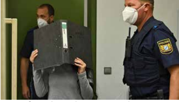
யாசிடி இன பெண் படுகொலை!