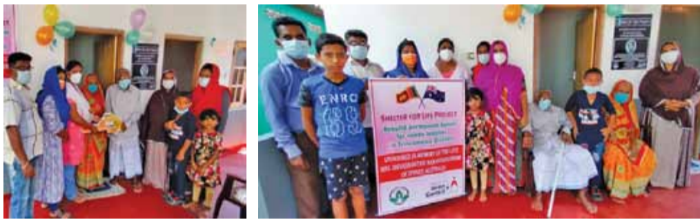
(ஹஸ்யர் ஏ ஹலீஸ்)

வாழ்வதற்கான இல்லறம் செய்றிட்டத்தின் கீழ் மற்றொரு நிரந்தர வீடு வன்னி ஹோப் அவுஸ்ரேலியா நிறுவனத்தின் அனுசரணையில் திருகோணமலை மக்கள் சேவை மன்றத்தினால் நேற்று குச்சுவெளிப் பிரதேசத்தில் திறந்து வைக்கப்பட்டு அவை பயனாளியிடம் கையளிக்கப்பட்டது. வன்னி ஹோப் நிறுவனமும் மக்கள் சேவை மன்றமும் இணைந்து ஓலைக் குடிசை மற்றும் தகரக் கொட்டிகளில் நீண்டகாலமாக பெரும் அசௌகரியங்களுக்கு மத்தியில் வாழ்ந்து வரும்