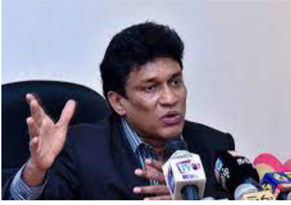
பஸிலின் அலாவுதீன் விளக்கு வேலை செய்தால் அடுத்த மாதம் பொருள்களின் விலைகள் குறையும் என நாடாளுமன்ற