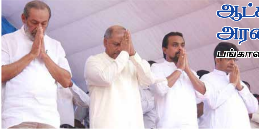
ஆட்சியைக் கவிழ்ப்பதற்காக அல்ல, அரசைப் பாதுகாக்கவே போராடுகின்றோம் என்று அறிவித்தல் விடுத்துள்ளனர்