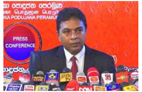
விசித்திரமாக உள்ளன. இது தொடர்பில் நாம் அலட்டிக் கொள்ள விரும்பவில்லை.

கூட்டத்துக்குச் சமூகமளிக்காதவர்கள் ஒவ்வொருவரும் ஒவ்வொரு காரணங்களைக் கூறியுள்ளனர். சில பங்காளிக் கட்சியினரின் காரணங்கள்