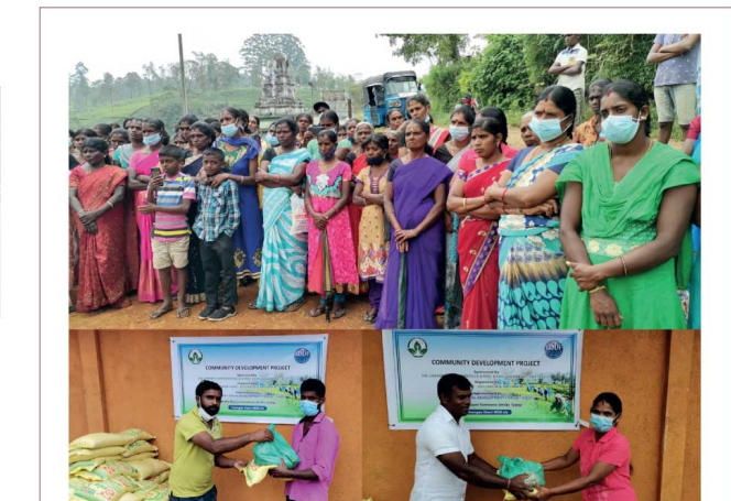
உதவிய கரங்கள்... சுத்த 90 மாதகாலயா வேலைநிறுத்தல் ஈடுகுடு வாழ்நாள்களு நேற்று, தலவாக்கலை -கட்டுக்கலை நோட்டத்தில் ஸ்பும் 119 குடும்க்களுக்கு வன்னிபேரே நிறுவனத்தின் குடும்க்கையிடம், மலையக 2020 ஈடுகுடுதி ரேவையால் உலரணம் பொருள்கள் வழங்கி வைக்கப்பட்டன.(சேதீன்)

மணலன் வீரத்தீர்ன் மாத்தளையிலிருந்து செலகம் வரை பயணித்த தனியார் பஸ்தொன்று மாத்தளை-கொடலென்னேவத்த பகுதியில் விபத்துக்குள்ளானதில் 13 பேர் காயமடைந்துள்ளனர். நேற்று (28) பகல் இந்த விபத்து இடம்பெற்றது. இவ்வாறு காயமடைந்தவர்கள் மாத்தளை பொது வைத்தியசாலையில் அனுமதிக்கப்பட்டுள்ளனர். காயமடைந்தவர்களுக்கு 3 வயது குழந்தையும் அடங்குவதாக பொலீஸார் தெரிவித்தனர். மற்றுமொரு வாகனமொன்றுக்கு இடமளித்த போகே, இந்த விபத்து இடம்பெற்றது. சம்பவம் தொடர்பில் மறுபெல பொலீஸார் விசாரணைகளை முன்னெடுத்து வருகின்றனர்.