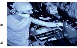
சந்தேகப்பரைப் பிடித்து ஹட்டன் பொலீஸில் உட்படத்துள்ளனர். இவ்வாறு கைதுசெய்யப்பட்டவர் கொழும்பு-செய்க்கத்த பிரிவே செயலாளர் என்றும் இவர் போகைப் பொருளுக்கு அப.மையானவர் என்றும் ஆரம்பக்கட்ட விசாரணைகளில் தெரிவந்துள்ளதாக பொலீஸார் தெரிவித்தனர்.