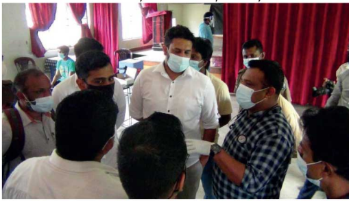
சாதாரண தரப்பிரிவைக்கு தேற்றியவர்கள் உட்பட்ட சமீன ஆயிரந்த 300 பேருக்கு தற்புட்சி ஏற்றும்கமான ஏற்பாடுகள் செய்ப்பட்டிருந்தன. தற்புட்சினை பெறுவதற்கு

தலவாக்கலை தமிழ் தேசிய, தலவாக்கலை சமீன தேசியக் கல்லூரிகள், பாரதி தமிழ் மகா, வட்டகொடை தமிழ் மகா, வட்டகொடை சிங்கை மகா, சென்சீளியார் தமிழ் மகா கிரேட்டுவெட்டில் தமிழ் மகா வித்தியாலயங்கள் ஆகியவற்றை நேற்ற 16-18 வயது பிரிவு மாணவர்களுக்கு நேற்று (28) சமீன தேசிய கல்லூரியில் 'ஸ்பைர்' தற்புட்சி ஏற்றும்கம் என அறிவிக்கப்பட்டிருந்தது. பாடசாலை வடிகு இடைவிலகிய,