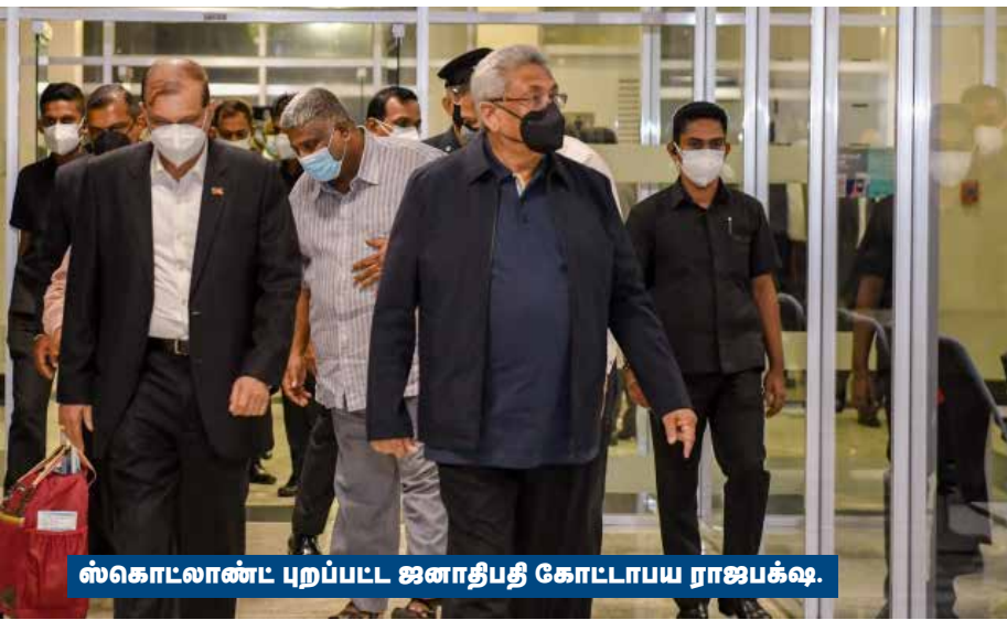
ஸ்கொட்லாண்ட் புறப்பட்ட ஜனாதிபதி கோட்டாபய ராஜபக்ஷ.

மார்ச், ஒக்ரோபர் 2021 காலப்பகுதிகளில் ஸ்ரீலங்கா விவகாரம் சர்வதேச மனித உரிமை மன்றில் விவாதத்திற்கு வந்த போது, இவை இனப்படுகொலை என்பதிலும் பார்க்க அவை அங்கிருந்து வெளியே எடுக்கப்பட்டு ஈ.நா. பாதுகாப்புச் சபைக்கு பாரப்படுத்தப்படவேண்டும் என்ற கோஷங்கள் வலுவடைந்தன.