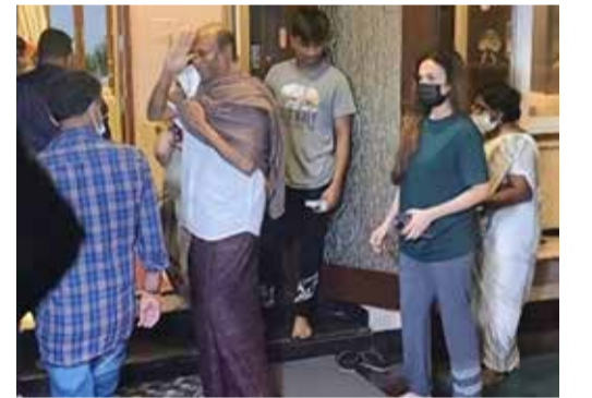
காலை காவேரி மருத்துவமனையில் ரஜினியை தமிழக முதல்வர் மு. க. ஸ்டாலின் சந்தித்து நலம் விசாரித்தார் என்பது குறிப்பிடத்தக்கது.

மூளைக்குச் செல்லும் ரத்த நாளமான கரோடிட் தமனியில் அடைப்பை நீக்கும் சிகிச்சை செய்யப்பட்டு, அதன்பின் கண்காணிப்பில் இருந்த ரஜினி நேற்று முன்தினம் இரவு வீடு திரும்பினார். போயஸ் கார்டன் வீட்டு வாசலில் ரஜினிக்கு ஆரத்தி எடுத்து அவரது குடும்பத்தினர் திருஷ்டி கழித்து அவரை அழைத்துச் சென்றனர். முன்னதாக நேற்று முன்னர்