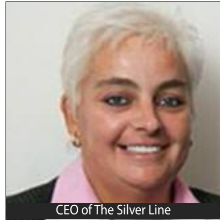
CEO of The Silver Line

பேசி முடித்து விட்டு மனப்பாரம் குறைய அறிவுரைக்கு நன்றி என்று சொல்லிவிட்டு அமைதியாக உட்கார்ந்து யோசிக்கும் போது, ‘தான்’ எல்லாவற்றையும் தவறான கண்ணோட்டத்திலேயே பார்த்திருக்கிறோம் என்பது புலப்படுகிறது. இப்போது வீடு, சுற்றம் என்று எல்லாவற்றையும் வேறு கோணத்தில் பார்க்க முடிகிறது. அவர்கள் கூறிய அறிவுரைக்கு மனதளவில் நன்றி சொல்லும் போதுதான் அவளுக்கு எதிர் முனையில் பேசியவர் அவளுக்கு எந்த அறிவுரையும் தரவில்லை. மாறாக அவள் பேசியதை எந்தக் குறுக்கீடும் இல்லாமல் அனுசரணையோடு கேட்டுக்கொண்டு மட்டுமே இருந்தார் என்பதே புரிகிறது. அதுமட்டுமன்றி, அந்த அன்பான குரலும், கரிசனமான அணுகுமுறையும், எந்த அச்சமும் தயக்கமும் இல்லாமல் தன் மனப்பாரத்தை இறக்கி வைக்க முடிந்த வாய்ப்புமே எதிர்மறையான எண்ணங்களை விலக்கி நேர்மறையான சிந்தனையை தனக்குத் தந்திருக்கிறது என்பதும் அதன் விளைவாகவே அவளால் இப்போது தெளிவாகச் சிந்தித்து ஒரு நல்ல முடிவெடுக்க முடிந்திருக்கிறது என்பதும் அவளுக்குப் புரிகிறது.