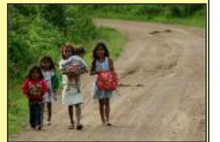
நாய்களாய் பேய்களாய் அலைகின்றோம்