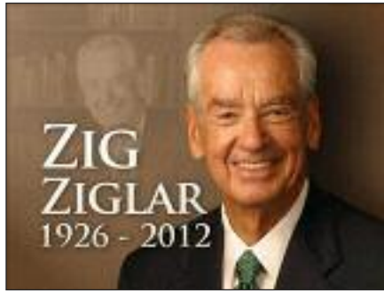
ZIG ZIGLAR 1926 - 2012

இன்னும் சிலர் இருக்கின்றனர், சொல்பவர்களின் உணர்வுகளுக்குள் தங்களைப் பொருத்திக்கொண்டு ஏதோ தாங்களே அந்த சூழ்நிலைக்குள் மாட்டிக் கொண்டதைப்போல் பதற்றம் அடைந்து பாதிக்கப்பட்டவரை விட அதிகம் பதறி அந்த சூழ்நிலையையே இன்னும் மோசமாக்கி விடுவர். இதனாலேயே பெரும்பாலும் பலர் தாங்கள் சொல்ல வந்ததை முழுமையாகச் சொல்லி அதற்குத் தீர்வு காணாமல் ஆரம்பித்த விடயத்தை முழுமையாகச் சொல்லாமல் ஏதேதோ சொல்லி சமாளித்து விட்டுப் பிரச்சினையை தீர்க்க முயற்சி செய்யாமல் விட்டு விடுவர்.