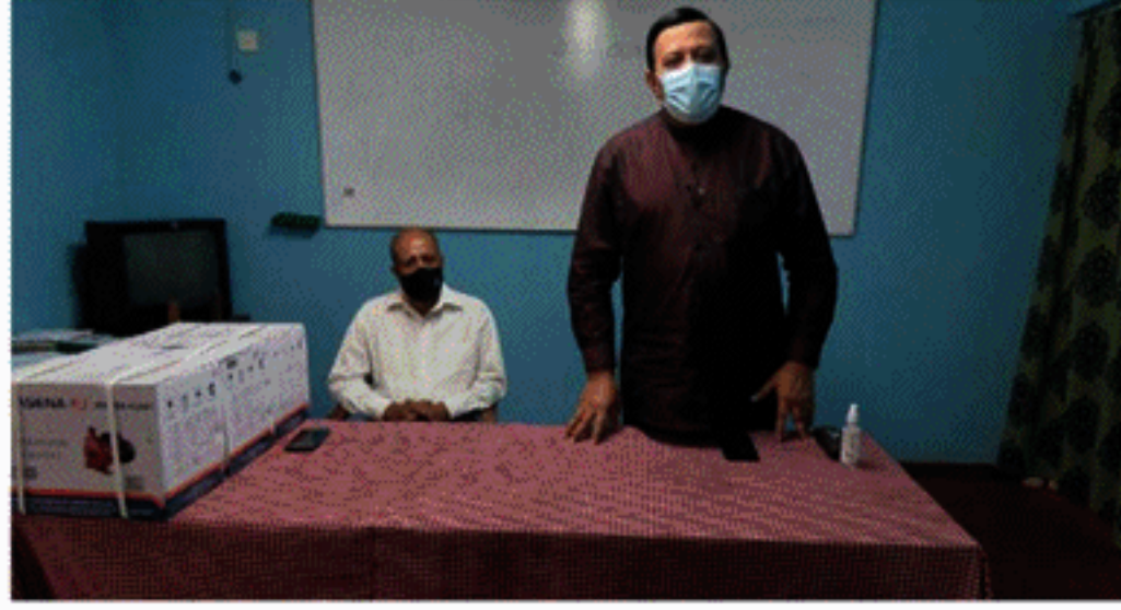
எம்மவர்களேயாவார். சிறு தோட்டை தேயிலை பயிர்ச்செய்கையை ஊக்குவிக்க வேண்டுமென்ற நோக்கோடு, அரசு செயற்படுவதன் காரணமாக பதுளை மாவட்டத்தில் தேயிலை கன்றுகளுக்கான தேவைகள் அதிகமாகவேயுள்ளது. கன்று தவறணைகளை வெற்றிகரமாக முன்கொண்டு செல்லுவதற்கான பயிற்சிகள், ஆலோசனைகள் மற்றும் கண்காணிப்புகள் போன்றவற்றை அதிகார சபையின் உத்தியோகத்தர்கள் கிராமமாக மேற்கொள்வர் என மேலும் குறிப்பிட்டார்.

சபையின் காரியாலயத்தில் நடைபெற்ற, அனுமதிப் பத்திரம், காசோலை, நீர் இரைக்கும் இயந்திரங்களை கையளக்கும் வைப்பத்தில் கலந்து கொண்டு உரையாற்றும் போதே இவ்வாறு குறிப்பிட்டார். அவர் தொடர்ந்து உரையாற்றுகையில், இவ்வாறான வாய்ப்புகளை பெற எம்மவர்கள் முயற்சி செய்தாலும் ஏதோவொரு காரணத்திற்காக அவர்கள் புறக்கணிக்கப்பட்ட நிலைமையே காணப்பட்டது. ஆனால், தற்போது தான் ஆளும் தரப்பில் இணைந்து செயற்படுவதன் காரணமாக, எவ்வித தடையுமின்றி எம் சமுதாயத்தைச் சார்ந்தவர்களுக்கு இந்த அரிய வாய்ப்பை பெற்றுக்கொடுக்க ஏதுவாயிற்று. இதனால் பெரும் பயனை அடையப் போவது