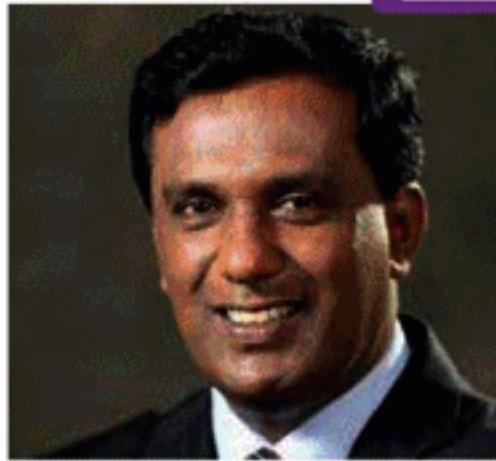
போன்ற ஆணைக்குழுக்கள் பற்றி கதைப்பதில்லை. ஞானசாரர், துமிந்த சில்வா போன்றவர்களுக்கு கொடுக்கின்ற முக்கியத்துவம் கூட இதற்கு வழங்கப்படுவதில்லை.

அது சுதந்திரமாக நடமாடித் திரியும். நமது தோட்டத்துக்குள் நுழைந்து பயிர்களை மேய்ந்தமைக்காக அதற்கு எதிராக எவரும் பொலிவில் முறைப்பாடு செய்வதுமில்லை. அது இறந்தாலும் எவரும் அதற்காக கவலைப்படுவதுமில்லை. 20 ஆவது அரசியலமைப்பு திருத்தத்தின் கீழ் ல்தாபிக்கப்பட்ட ஆணைக்குழுக்கள் கைவிடப்பட்ட முதுகில் குடு குத்தப்பட்ட மாட்டை போன்றதாகும். குறைந்தபட்சம் தேர்தலில் அதிகாரத்தை கைப்பற்ற எதிர்வாக்குகும் அரசியல் கட்சியொன்று கூட, இப்போது அரசுசேவை இலஞ்ச சம்பந்தம், பொதுப் பயன்பாடுகள் அரசுகளும் மொழிகள் எல்லை நிர்ணயம்