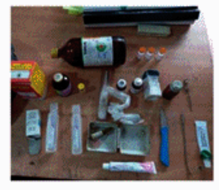
பொலிஸ் நிலையத்தில் ஒப்படைக்கப்பட்டுள்ளார். கொட்டியாகலை தோட்டத்திலுள்ள கால்நடை ஒன்றுக்கு, ஒட்டோவில் வருகைத் தந்து சிகிச்சையளிப்பதாக கிடைத்த தகவலின் பேரில், பொகவந்தலாவை கால்நடை மருத்துவ அலுவலக அதிகாரிகளால் பிடிக்கப்பட்டு, மருத்துவ உபகரணங்களும் பொலிஸாரின் பொறுப்பில் எடுக்கப்பட்டுள்ளது.

கால்நடை மருத்துவராக தன்னை அடையாளம் காட்டிக்கொண்டு, நோய்த்தொற்றுக்கு உள்ளாகும் கால்நடைகளுக்கு வைத்தியம் செய்த சந்தேகநபர் ஒருவர், பொகவந்தலாவை கால்நடை மருத்துவ அலுவலக அதிகாரிகளால் பொகவந்தலாவை பொலிஸ் நிலையத்தில் ஒப்படைக்கப்பட்டுள்ளார். சந்தேகநபர் தன்னை கால்நடை மருத்துவராக அடையாளப்படுத்தி கொண்டு, பெருந்தோட்டைகளில் நோய்த்தொற்றுக்கு உள்ளாகும் கால்நடைகளுக்கு சிகிச்சை அளிப்பதுடன், இதற்காக பெருந்தொகை பணத்தையும் அறிவிடுவதாக கிடைத்த தகவலின் பேரில், இவர் பிடிக்கப்பட்டு