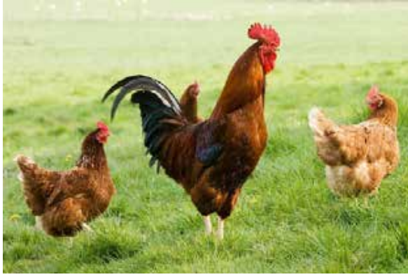
வளாகத்தில் ஃபெசன்ட்கள் மத்தியில் கண்டறியப்பட்ட ஸூதிலிருந்து வேல்ஸில் இந்த நோய்க்கான முதல் உறுதிப்படுத்தல் இதுவாகும்