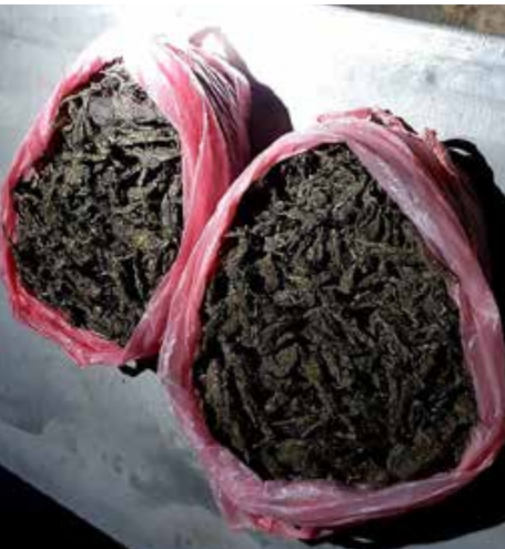
களின் பின் நீதிமன்றில் ஆஜர்படுத்த நடவடிக்கை எடுத்துள்ளனர் எனத் தெரிவிக்கப்படுகின்றது. 100

வவுனியா, தவசிகுளம் பகுதியில் இளைஞர் ஒருவர் விசேட அதிரடிப் படையினரால் கைது செய்யப்பட்டு, தம்பிடம் ஒப்படைக்கப்பட்டுள்ளார் என வவுனியா பொலிஸார் தெரிவித்துள்ளனர். விசேட அதிரடிப் படையினருக்கு கிடைத்த இரகசிய தகவலையடுத்து வவுனியா, தவசிகுளம் பகுதியில் நேற்று (வியாழக்கிழமை) அதிகாலை திடீர் சோதனை நடவடிக்கை ஒன்றை விசேட அதிரடிப் படையினர் மேற்கொண்ட போது ஒரு கிலோ 600 கிராம் கேரளக் கஞ்சா மீட்கப்பட்டது. இதனையடுத்து இதனை உடமையில் வைத்திருந்த குற்றச் சாட்டில் அப்பகுதியைச் சேர்ந்த 26 வயது இளைஞர் ஒருவர் கைது செய்யப்பட்டுள்ளார். மீட்கப்பட்ட கேரளா கஞ்சா மற்றும் கைது செய்யப்பட்ட இளைஞர் ஆகியோரை விசேட அதிரடிப் படையினர் வவுனியா பொலிஸாரிடம் ஒப்படைத்துள்ளனர். வவுனியா பொலிஸார் இது தொடர்பில் மேலதிக விசாரணைகளை முன்னெடுத்துள்ளமையுடன், விசாரணை