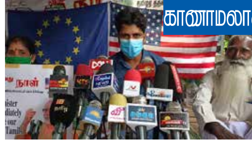
காணாமலாக்கப்பட்டோர் உறவுகள் தொழிபு