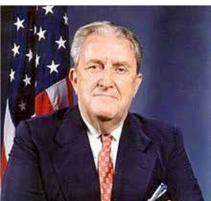
ஜனரல் வேர்னன் வால்டேர்ஸ்

எண்ணங்களிலேயே தமிழர் கோரிக்கைகளை அடித்தளமாக்கி இந்தியா-இலங்கை ஒப்பந்தம் ஏற்படுத்தப்பட்டது. அமெரிக்காவின் உதவியில் பாகிஸ்தான் அவர்களின் கால்வழியாக இருந்தது. அந்த ஒழுங்குகளால் காஷ்மீரில் இந்தியாவுக்கு தலையிடி. ஸ்ரீலங்காவிலும் அப்படியான ஒரு நிலையை வளரவிட இந்தியா விரும்பவில்லை.