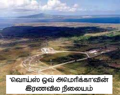
‘வொய்ஸ் ஒவ் அமெரிக்கா’வின் இரணவில்லி நிலையம்

466. அமெரிக்க ஸ்ரீலங்காவின் பின்னணி என்ன? ஏன் அந்த முக்கியத்துவம்? அமெரிக்காவுக்கு ஸ்ரீலங்காவுடன், கட்டமைப்புகளுடனான ஆழமான உறவு இருந்தது. 1951 இல் இருந்து அமெரிக்காவின் ஒலிபரப்புச் சேவையை (Voice Of America) அங்கீகரித்து நடத்துவதற்கு இருந்த ஏற்பாடுகள் 1983 இல் இரணவில்லில் 500 ஏக்கர் பரப்பிலான காணியில் விஸ்தரிக்கப்பட்டு ஆசியாவின் பல பகுதிகளையும் எட்டக் கூடிய சேவையாக வளர்ந்தது. 1950 இலிருந்தே அமெரிக்காவின் இராணுவ அதிகாரிகள் திருகோணமலை தங்களைத் தளங்களாக இயக்கப்படுவதற்கான அதிகாரம் தமக்கு உண்டு என்ற மனப்பாங்கு கொண்டிருந்தனர். 1997 இல் ஜே. ஆர். பதவிக்கு வந்ததும், அமெரிக்காவுடனான புது உறவை மறைமுகமாகவும், வெளிப்படையாகவும் வளர்த்தார்.