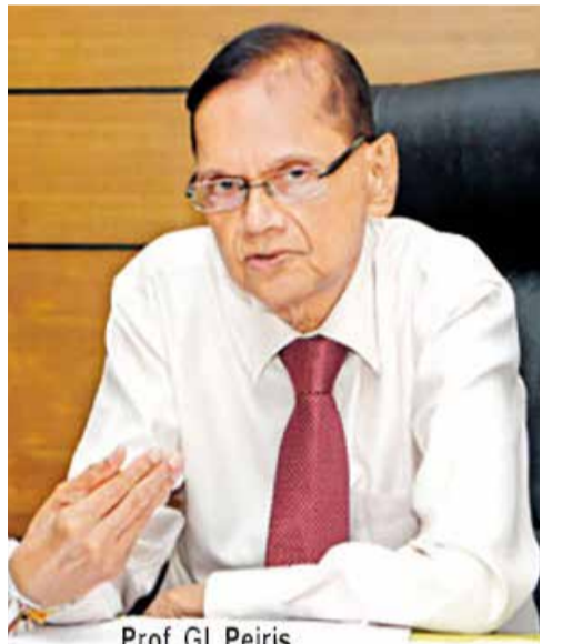
Prof. GL Peiris

கொழும்பு, நவ. 08 ஆளும் தரப்பிலுள்ள கட்சிகளுக்கு கிடைசில் சில கருத்து முரண்பாடுகள் ஏற்படக்கூடும். எனினும் அரசாங்கம் என்ற ரீதியில் அனைவரும் ஒன்றிணைந்து எடுக்கும் தீர்மானங்களுக்கு அனைவரும் ஒத்துழைப்பு வழங்க வேண்டும். கடந்த வாரம் முன்னெடுத்த விஜயத்தின் பலனாக இங்கிலாந்திலிருந்து இலங்கைக்கு பெரும் முதலீடுகள் கிடைக்கப் பெறவுள்ளன என்ற வெளிநாட்டலுவலர்கள் அமைச்சர் பேராசிரியர் ஜி. எல். பீரிஸ் தெரிவித்தார்.