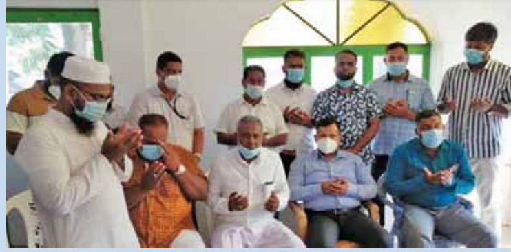
டன் மக்கள் சந்திப்பிலும் ஈடுபட்டார் இதன் போது மக்கள்

குறித்த விஜயமானது நேற்று முன்தினம் (06) இடம் பெற்றது