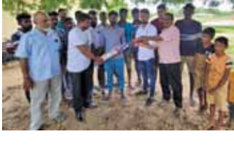
(ஹஸ்பர் ஏ ஹலீம்)

மூதூர் லிங்கபுரம் ஆதியம் மன்கேணி எவெரெஸ்ட் விளையாட்டு கழகத்தினால் தேசிய ஜனநாயக கட்சியிடம் விடுக்கப்பட்ட வேண்டுகோளுக்கு இனங்க கடின பந்து மற்றும் துடுப்பாட்ட மட்டை வழங்கி வைக்கப்பட்டது. பின் தங்கப்பட்ட கிராமத்தில் வசிப்பதனால் தங்களுக்கு எந்தவிதமான நிறுவனம் மூலமாகவோ, அரசாங்க தரப்பு மூலமாகவோ, அரசியல் கட்சிகள் சார்பாக எவ்விதமான உதவிகளும் கிடைக்கப்பெறவில்லை என்பதனையும் கடினப் பந்து பயிற்சியை மேற்கொள்ள ஆர்வம் இருந்த பொழுதிலும் பின்னங்கிய கிராமத்தில் வசிப்பதனால் அதற்குரிய உபகரணங்களை எம்மால் உடனடியாக பெற்றுக்கொள்ள முடியாத நிலைமையில் நாம் இருந்தோம். கிராமத்திற்கு வருகை தந்த தேசிய ஜனநாயக கட்சியின் தலைவர் கிரிசான் குமார் விளையாட்டு உபகரணங்களை வழங்கி வைத்தார்