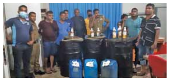
பரள்கள் என்பன கைப்பற்றப்பட்டுள்ளன. குறித்த கசிப்பு உற்பத்தி நிலையத்தை நடாத்தி வந்த மூவர் தப்பழயோடி விட்டதாகவும் அவர்களை கைது செய்வ நடவடிக்கைகள் மேற்கொள்ளப்பட்டுள்ளதாகவும் பொலீசார் தெரிவித்தனர்.

நேற்று மாலை 8 மணியளவில் கடும்கு மழைக்கு மத்தியிலும் கொக்கொட்டிச்சேலை சந்திமலைப் பகுதியில் மேற்கொள்ளப்பட்ட பாரிய கசிப்பு உற்பத்தி நிலையம் முற்றுகையின்போது 135000 மில்லி லீற்றர் கசிப்பு 630000 மில்லி லீற்றர் கோடா மற்றும் இரு