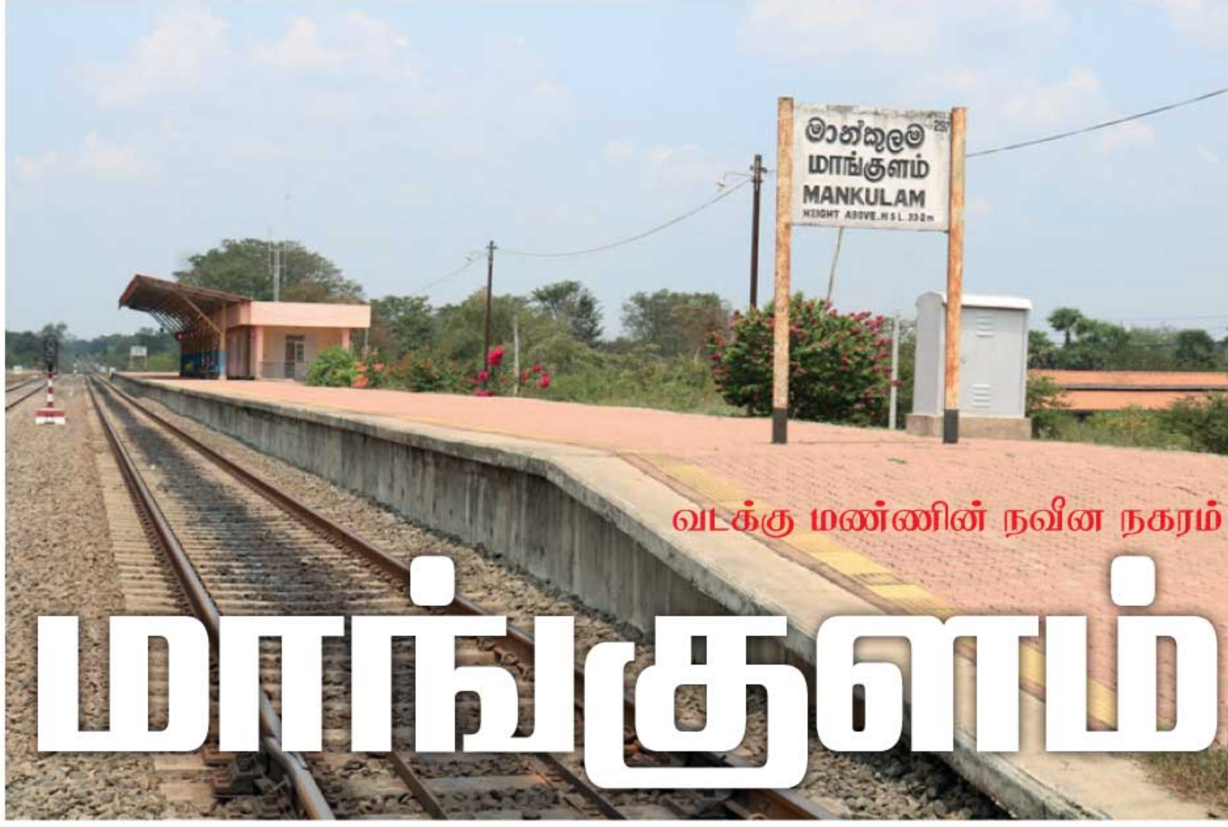
வடக்கு மண்ணின் நவீன நகரம்