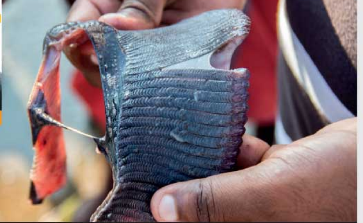
ஆனைத்திருக்கைக்கும் கொம்புத் திருக்கைக்கும்

ஆனைத்திருக்கை மற்றும் கொம்பு திருக்கை போன்றன, எமது சமுத்திரத்தில் காணப்படும் மிகவும் வித்தியாசமான மற்றும் கவரக்கூடிய மீன் வகையாக அமைந்துள்ளன. அவற்றின் பெயரைப் போலன்றி, முற்றிலும் ஆபத்தை ஏற்படுத்தாதவையாக உள்ளன.