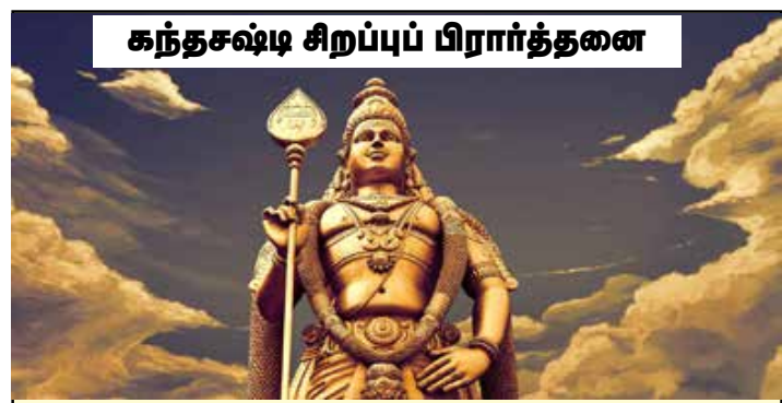
கந்தசஷ்டி சிறப்புப் பிரார்த்தனை