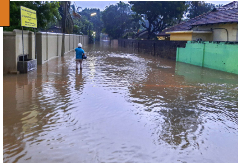
நாட்டின் பல்வேறு பகுதிகளிலும் சீரற்ற வானிலை நிலவி வரும் நிலையில், பல பகுதிகள் வெள்ளத்தில் மூழ்கியுள்ளன. இந்தநிலையில் யாழ்ப்பாணம் நல்லூர் பகுதியும் வெள்ளத்தில் மூழ்கியுள்ளதாகத் தெரிவிக்கப்படுகின்றது.