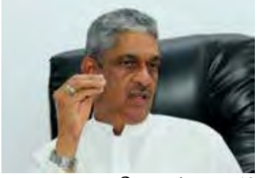
கொழும்பு, நவ. 10 நிதி அமைச்சர் பஸில் ராஜ பக்வால் முன்வைக்கப்படவுள்ள வரவு - செலவுத் திட்டம் மீது