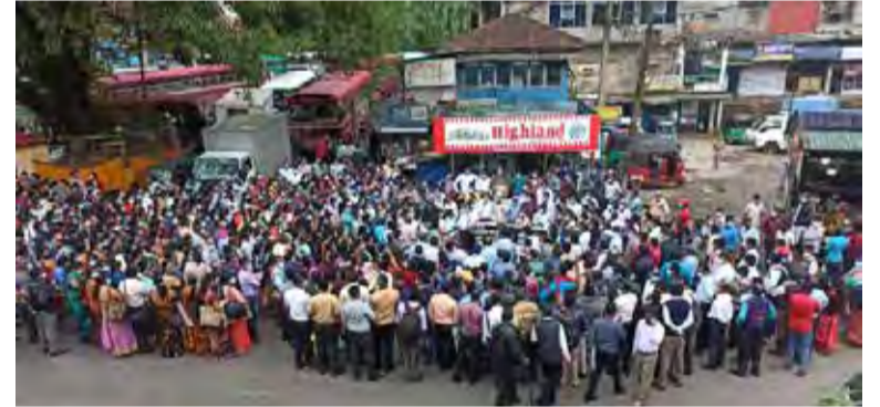
கோரிக்கையான அதிபர் - ஆசிரியர்களின் கொடுப்பனவை வழங்கக் கோரியும், கல்வித் துறையிலுள்ள பல்வேறு பிரச்சனைகளுக்குத் தீர்வைப் பெற்றுத்தரக் கோரியும் கோஷம் எழுப்பப்பட்டது. (இ)