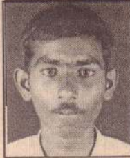
வேலும்மயிலும் சுதன் 2ஏ, பி மாவட்டநிலை 1 கலைப்பிரிவு முல்லைத்தீவு மாவட்டம்

முல்லைத்தீவு, புதுக்குடியிருப்பு மகாவித்தியாலயத்தில் கல்வி கற்றுவந்த இம்மாணவன் யுத்தம் காரணமாக இடம்பெயர்ந்து மிருசுவில் நலன்புரி நிலையத்திலிருந்து பரீட்சைக்குத் தோற்றி சித்தியடைந்துள்ளார். தன்னுடைய பெறுபேறு குறித்து அவர் இங்கு விளக்குகிறார்.