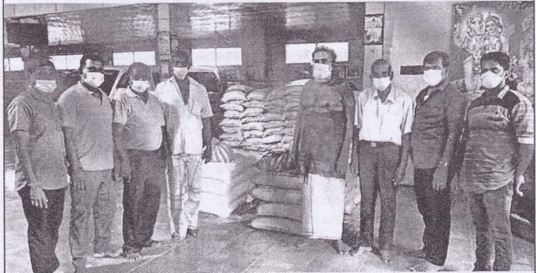
வடமராட்சி தனியார் பஸ் சேவைச் சங்கத்தின் நடத்துனர், சாரதி சார்ந்த 102 குடும்பங்களுக்கு 2,10,000 ரூபா பெறுமதியான உலர் உணவுப் பொருட்கள் வழங்கப்பட்டது.

ஒரு காரியம் நிறைவேறும் வரை அவற்றைப்பற்றி அறிவாளி வெளியில் சொல்லமாட்டான்.