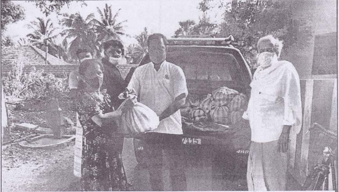
யாழ்ப்பாணப் பிரதேச செயலர் பிரிவுக்குட்பட்ட கொட்டடி பிரதேச கிராம சேவையாளர் பிரிவுக்குட்பட்ட 22 குடும்பங்களுக்கு உணவுப் பொருட்கள் வழங்கப்பட்டது.