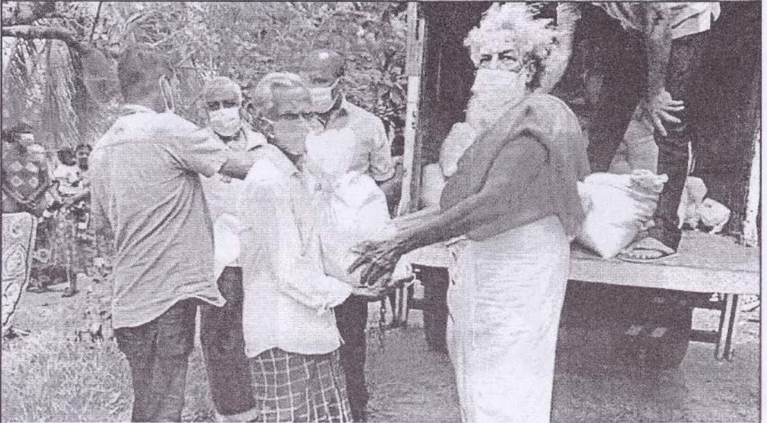
திருகோணமலை மாவட்டம் மொறவேவ பிரதேச செயலர் பிரிவுக்குட்பட்ட 128 குடும்பங்களுக்கு தலா 3000 ரூபா பெறுமதியான பொருட்கள் வழங்கப்பட்டது.