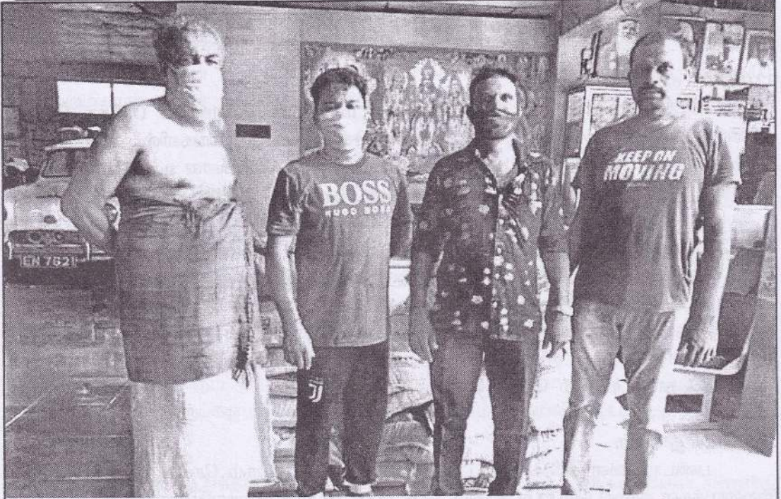
காங்கேசந்துறை 769 பயணிகள் சிற்றூர்திச் சேவை நடத்துனர், சாரதி சார்ந்த 72 குடும்பத்தினருக்கு 1,65,000 ரூபா பெறுமதியான உணவுப் பொருட்கள் வழங்கப்பட்டது.