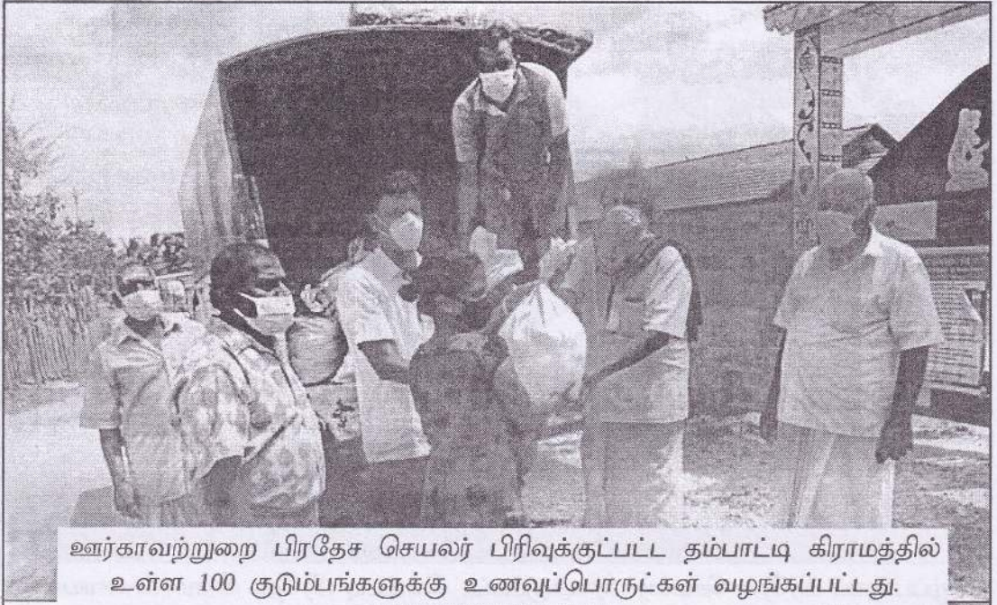
ஊர்காவற்றுறை பிரதேச செயலர் பிரிவுக்குட்பட்ட தம்பாட்டி கிராமத்தில் உள்ள 100 குடும்பங்களுக்கு உணவுப்பொருட்கள் வழங்கப்பட்டது.