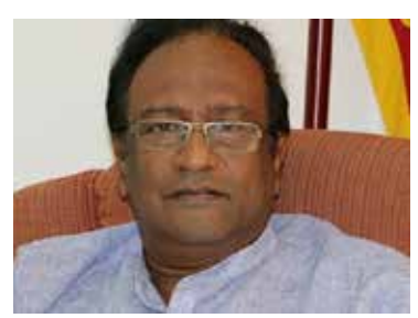
ஈஸ்டர் தாக்குதலின் சூத்திரதாரி சஹ்ரான், புலனாய்வுப் பிரிவைச் சேர்ந்த எவரையும் சந்திக்கவில்லை

என்பது ஆதாரங்களின்படி தெரியவந்துள்ளதாக பொதுமக்கள் பாதுகாப்பு அமைச்சர் சரத் வீரசேகர தெரிவித்தார். நாடாளுமன்றத்தில் நேற்று (வியாழக்கிழமை) உரையாற்றும் போதே அவர் இவ்வாறு தெரிவித்தார். சபையில் விசேட அறிக்கையொன்றை விடுத்த அமைச்சர் - ஈஸ்டர் தாக்குதலுக்கு முன்னரும் பின்னரும் சஹ்ரானின் மனைவி விசாரிக்கப்பட்டார் எனவும், தனது கணவர் புலனாய்வு அதிகாரிகளை