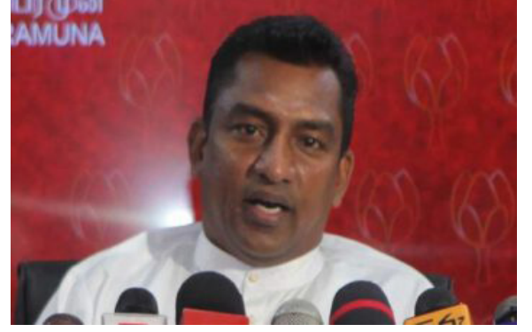
னவர்களை எமது கட்சித் தலைவர்கள் வெளியேற்ற வேண்டும். - எனக் குறிப்பிட்டுள்ளார்.

விமர்சிப்பதாக இருந்தால் வெளியே சென்று விமர்சிக்க வேண்டும். அவ்வாறு இல்லாவிட்டால் இவ்வாறு