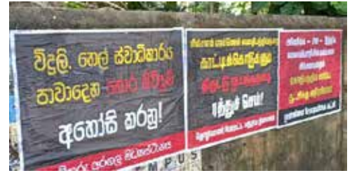
போன்ற வாசகங்கள் காட்சிப்படுத்தப்பட்ட சுவராட்டிகளுக்கு தொழிலாளர் போராட்ட மத்திய நிலையம் மற்றும் முன்னிலை சோசலிசக் கட்சி என்பன உரிமை கோரப்பட்டுள்ளமை குறிப்பிடத்தக்கது.

வவுனியாவில் பல்வேறு இடங்களில் அரசாங்கத்தின் செயற்பாட்டுக்கு எதிராகத் தமிழ்சிங்களத்தில் எழுதப்பட்ட சுவராட்டிகள் ஒட்டப்பட்டுள்ளன. குறித்த சுவராட்டிகளில் மின்சாரம் எண்ணெய்சூயா திபத்தியத்தை காட்டிக்கொடுக்கும் திருட்டு ஒய்ந்தத்தை ரத்துச் செய்ய அமெரிக்க - சீன - இந்திய மரணப்பொறியில் மக்களை சிக்க வைக்கும் ஏகாதிபத்திய சார்பு ஆட்சிக்கு எதிராவோம்.