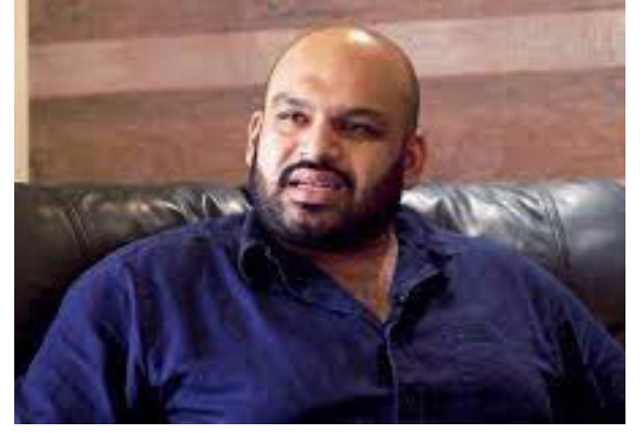
குறிப்பாக தபால் மூலமாகவேனும் அவர்கள் வாக்களிப்பதற்கு தேவையான நடவடிக்கையினை அரசாங்கம் செய்ய வேண்டும். இதுகுறித்து அரசாங்கம் உடனடியாக கவனம் செலுத்தும் என நம்புகின்றேன் - எனக் குறிப்பிட்டுள்ளார்.

யினை பெற்றுக்கொள்வது இலகுவாக இருந்தாலும், அதற்கான கட்டணத்தினை குறைப்பதற்குரிய நடவடிக்கைகளை அரசாங்கம் எடுக்க வேண்டும். இலங்கையில் தற்போது டொலருக்கான பெறுமதியில் வீழ்ச்சி ஏற்பட்டிருக்கின்ற நிலையில், அரசாங்கம் இரட்டைப் பிரஜாவுரிமைக்கான கட்டணத்தினை குறைப்பதற்குரிய நடவடிக்கைகளை எடுக்க வேண்டும். இரட்டைப் பிரஜாவுரிமையுள்ள அமைச்சர் உள்ள நாட்டில், வெளிநாடுகளிலுள்ள புலம்பெயர் தமிழர்கள் பலரும் இரட்டைப் பிரஜாவுரிமையினை பெற்றுக்கொள்வதில் ஆர்வமாகவே உள்ளனர். எனவே அவர்களுக்கு விரைவாக இரட்டைப் பிரஜாவுரிமையினை வழங்கி, வெளிநாடுகளிலுள்ள இலங்கையர்கள் வாக்களிப்பதற்கான ஏற்பாடுகளை செய்ய வேண்டும்.