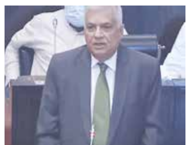
தாக்குதல் இடம்பெற்ற உடனடியே, பொலிஸாரும் சி. ஐ. டி. யினரும் இணைந்துதான் பொாரணை உள்ளிட்ட பகுதிகளில் பதுங்கியிருந்த சூத்திரதாரிகளை கைது செய்தார்கள். மாறாக புலனாய்வுப் பிரிவினர் அல்ல என்பதையும் நான் இங்கு தெரிவித்துக்கொள்கிறேன். - என அவர் மேலும் தெரிவித்துள்ளார்.

மேற்கொள்ளப்படவில்லை. இந்த விடயத்தை யாரும் அரசியல் மயப்படுத்தக்கூடாது. விசாரணை அறிக்கைகளை ஏன் நாடாளுமன்றத்துக்கு சமர்ப்பிக்கவில்லை என்பதுவே எமது கேள்வியாகும். சாதாரணமாக எந்தவொரு ஆணைக்குழுவில் விசாரணைகள் நடக்கும்போதும் சாட்சிகளின் வாக்குமூலம் உள்ளிட்டவற்றின் அறிக்கைகளை வெளிப்படுத்திக்கொண்டுதான் வருகிறோம். இவற்றை சபையில் இருந்து மறைக்க முடியாது. அவ்வாறு விசாரணைகளை மறைப்பது எமது வரப்பிரசாதங்களை மீறும் செயற்பாடாகும்.