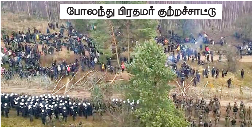
போலந்து பிரதமர் குற்றச்சாட்டு

இதனிடையே போலந்து பெலாரஸ் எல்லையில் அகதிகளால் ஏற்பட்டுள்ள பதற்றம் குறித்து விளாடிமீர் புடின், ஜேர்ப