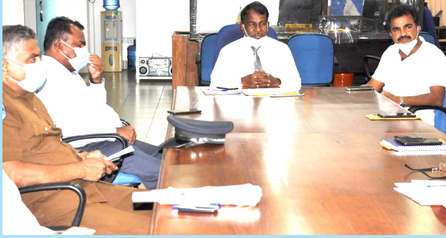
மட்டக்களப்பு மாநகர சபையின் ஊடாக பெற்றுக்கொடுப்பதற்கு தீர்மானிக்கப்பட்டுள்ளது. மக்களின் நீண்ட கால

மட்டக்களப்பு மாவட்ட அரசாங்க அதிபர் கணபதிப்பிள்ளை கருணாகரன் தலைமையில் நகர அபிவிருத்தி அதிகார சபையின் முன்மொழிவில் முன்னெடுக்கப்படவுள்ள நடைபாதை அமைத்தல் தொடர்பான கலந்துரையாடலில் மண்ணினால் அமைப்பது தொடர்பாக முன்வைக்கப்பட்ட யோசனை நிராகரிக்கப்பட்டு புதிய யோசனை முன்வைக்கப்பட்டுள்ளதுடன் மேலதிகமாக செலவு செய்யப்படவுள்ள நிதியினை