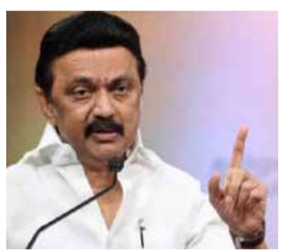
தமிழகம் அதன் பழம்பெரும் கலாச்சாரத்திற்கும், வளமான பாரம்பரியத்திற்கும் பெயர் பெற்றது. தமிழக மக்கள் தங்களின் மொழியைப் பெருமித அடையாளமாகக் கருதுகின்றனர். நமது பிரதமரும் கூட தனது உரைகளில் தமிழ் இலக்கியங்களில் இருந்து மேற்கோள்களைச் சுட்டிக் காட்ட மறப்பதில்லை. இந்தியாவின் செம்மொழியாகவும் உள்வாறு முதல்வர் உரையில் தமிழ் மொழி குறித்து குறிப்பிடப்பட்டுள்ளது.

சென்னை, நவ. 16 தமிழை ஆட்சி மொழியாகவும், திருக்குறளை தேசிய நூலாகவும் அறிவிக்க வேண்டும் என மத்திய அரசை தமிழக முதல்வர் மு.க.ஸ்டாலின் வலியுறுத்தியுள்ளார். ஆந்திர மாநிலம் திருப்பதியில், தென்மாநில முதல்வர்கள் கூட்டம் நடைபெற்றது. இதற்கு உள்துறை அமைச்சர் அமித் ஷா தலைமை தாங்கினார். இந்த நிகழ்வில் தமிழக முதல்வர் ஸ்டாலினால் நேரடியாக கலந்து கொள்ள இயலவில்லை. அதனால், தமிழகப் பிரதிநிதியாக அமைச்சர் பொன்முடி சென்றிருந்தார். அவர் முதல்வர் ஸ்டாலினின் உரையை அங்கு வாசித்தார். முதல்வர் ஸ்டாலின் உரையில் தமிழ் மொழி குறித்து இடம்பெற்ற தகவல்கள் வருமாறு: