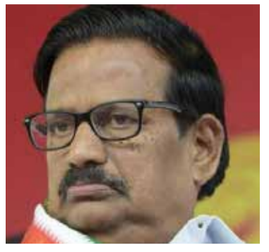
ணத்தினால் ஏற்பட்ட வரலாறு காணாத பேரழிவுகளை மூடி மறைப்பதற்காக, 100 கோடி தடுப்பூசி போட்டிருப்பதைக் கொண்டாடுகிற வகையில் பல்வேறு நடவடிக்கைகளில் மத்திய பா.ஜ.க. அரசு ஈடுபட்டு வருகின்றது” என்று தெரிவித்துள்ளார்.