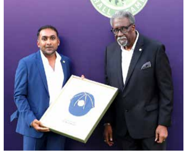
முன்றாவது இலங்கை வீரர் மஹேல ஆவார். முன்னதாக முதலையா முரளிதரன், குமார் சங்ககார ஆகியோர் இந்தப் பட்டியலில் இடம்பெற்றுள்ளனர் என்பது குறிப்பிடத்தக்கது. (ஐ)