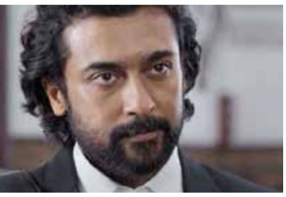
படத்தில் குற்றவாளி கதாபாத்திரத்துக்கு வைத்திருந்த பெயர் மற்றும் குற்றவாளி கதாபாத்திரத்தின் பின்பக்கம் வன்னியர்களின் அடையாளம் இடம்பெற்றது போன்றவை தொடர்பாக விமர்சனங்கள் எழுந்தன. இதை தொடர்ந்து அந்த காட்சி நீக்கப்பட்டது. எனினும், இந்த விவகாரம் தொடர்பாக நடிகர் சூரியாவுக்கு பா.ம.க. மற்றும் வன்னியர் சங்கத்தினர் எதிர்ப்பு தெரிவித்து வந்தனர்.