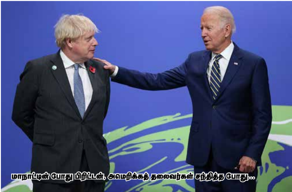
மாநாட்டின் போது பிரிட்டன், அமெரிக்கத் தலைவர்கள் சந்தித்த போது...

ஓப்பந்தத்தில் எட்டப்பட்ட முக்கிய மைல்கற்கள் ▶ 1.5 டிகிரிக்கு மேல் புவி வெப்பநிலை உயராமல் பார்த்துக்கொள்ளவேண்டும் என்ற இலக்கை எட்டுவதற்கு ஒப்புக்கொள்ளப்பட்ட திட்டங்களை அடுத்த ஆண்டு மீண்டும் மறுபரிசீலனை செய்வது. ▶ முதல் முறையாக நிலக்கரி பயன்பாட்டை குறைப்பதற்கு ஒப்புக்கொண்ட சர்வதேச ஒப்பந்தம். ▶ வளரும் நாடுகளுக்கு மேலும் அதிக நிதியுதவி.