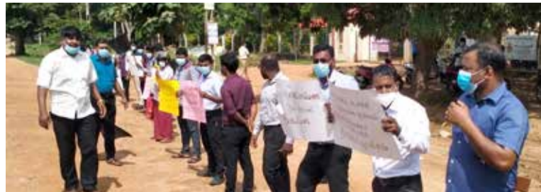
அமைப்புக்கள், பாடசாலை அபிவிருத்தி சங்கம், பெற்றோர்கள், மாணவர்கள் எனப் பலர் கலந்து கொண்டு கவனவீர்ப்பு போராட்டத்தை முன்னெடுத்தனர். ஆர்ப்பாட்டத்தில் ஈடுபட்ட

8 மணியளவில் கிளிநொச்சி மத்திய கல்லூரி முன்பாக மூன்று வாகனங்கள் ஒன்றுடன் ஒன்று மோதி ஏற்பட்ட விபத்தால் பாதசாரி கடவையை கடக்க முற்பட்ட மாணவி ஒருவர் ஸ்தலத்திலேயே உயிரிழந்தார். இந்த சம்பவத்தை கண்டித்து நேற்று சிவில் சமூக