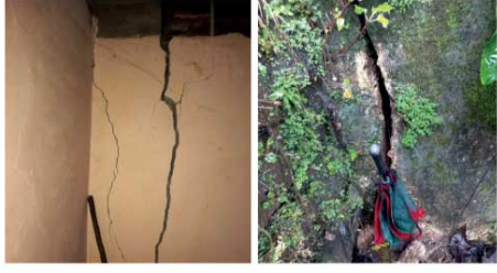
உள்ளிட்டவர்கள் மண்சரிவு எச்சரிக்கை விடுக்கப்பட்டுள்ள கிராமத்துக்குக் கண்காணிப்பு