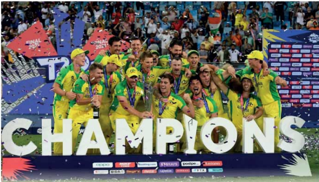
இருபதுக்கு - 20 உலகக் கிண்ணத் தொடர்: