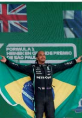
நெதர்லாந்தின் வெர்ஸ்ட்டப்பன் உடன் நிலையில், 318.5 புன்சின்மூடன் இரண்டாமிடத்தில் ஹமில்டன் உள்ளதோடு, 203 புன்சின்மூடன் மூன்றாமிடத்தில் பின்லாந்தின் போதையில் காணப்படுகின்றனர்.

பிரேவில்லின் சா போலோ குரான் பிரிவில், ஹெட் புல் அணியின் மக்ஸ் வெர்ஸ்ட்டப்பனை முந்தி நடப்பு போர்டியூவா வான் சம்பியனை ஹமில்டன் வென்றார். கார்னில் மாற்றத்தை மேற்கொண்டமை காரணமாக 10-ஆம் இடத்தில் இருந்து நேற்று முன்தினையே முதல்க்கை ஹமில்டன் ஆரம்பித்தமை குறிப்பிடத்தக்கது. பந்தங்களை முதலாமிடத்தில் இருந்து ஆரம்பித்த பிரித்தானியாவின் ஹமில்டன் ஓன் மெர்சிடஸ் அணி ஒருநாளை வலட்டேரி போதையில் மூன்றாமிடத்தைப் பெற்றார். அத்தகைய நிலைமைகளான போர்டியூவா வான் புன்சின் பட்டியலில் 332.5 புன்சின்மூடன் முதலாமிடத்தில்