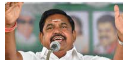
விதமாக பேசுகிறார். மக்கள் படும் அவதிகள், துன்பங்கள், துயரங்களை நாங்கள் அரசின் கவனத்திற்கு எடுத்துச் சென்றால் அவர் விசாரணை ஆணைக்குழு போடுவதாக கூறுகிறார். அதைப்பற்றி நாங்கள் கவலைப்படவில்லை" என எடப்பாடி பழனிச்சாமி கூறினார்.

பழனிச்சாமி நிருபர்களுக்கு பேட்டி அளித்தார். அப்போது அவர் கூறியதாவது: - "தற்போதைய அரசு சரியான முறையில் திட்டமிட்டு செயல்படாத காரணத்தினாலேயே மழைநீர் தேங்கி மக்கள் அவதிக்குள்ளாகி உள்ளனர். வெள்ளநீர் தேங்குவதை நாங்கள் குற்றச்சாட்டாக கூறினாலும், அதற்கு மறுப்பு தெரிவிக்காமல் முதலமைச்சர் மு.க.ஸ்டாலின் ஆட்சி அதிகாரத்தில் இருந்து கொண்டு எதிர்க்கட்சியை மிரட்டுகின்ற