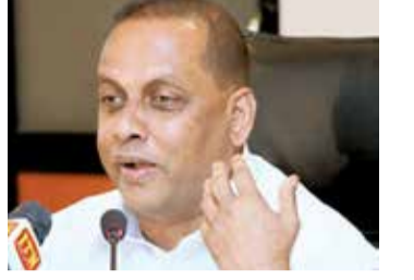
பதைக் காணக்கூடியதாக உள்ளது.

கொழும்பு, நவ. 17 சப்புக் கந்தை எண்ணெய் சுத்திகரிப்பு நிலையம் மூடப்பட்டாலும் நாட்டில் எந்தவித எரிபொருள் தட்டுப்பாடும் ஏற்படாமல் இருப்பதற்கு அரசு நடவடிக்கை எடுக்கவுள்ளது என அமைச்சர் மஹிந்த அமரவீர தெரிவித்துள்ளார். நாட்டில் தற்போது ஏற்பட்டுள்ள எரிபொருள் பிரச்சனை தொடர்பில் நேற்றுமுன்தினம் நடைபெற்ற அமைச்சரவைக் கூட்டத்தில் விரிவாகக் கலந்துரையாடப்பட்டுள்ளது. சப்புக் கந்தை எண்ணெய் சுத்திகரிப்பு நிலையத்தைக் குறைந்தது 50 நாட்களேனும் மூட வேண்டிய நிலை ஏற்பட்டுள்ளது என வலுசக்தி அமைச்சர் உதய கம்மன்பில நேற்றுமுன்தினம் தெரிவித்திருந்தார். இதையடுத்து நாட்டின் பல பாகங்களில் உள்ள எரிபொருள் நிரப்பு நிலையங்களில் மக்கள் நீண்ட வரிசையில் காத்திருப்பதைக் கண்டறிந்தார்.