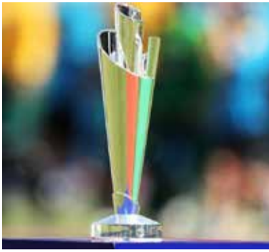
டிகளும், இறுதிப் போட்டி மெல்பேர்ன் நகரத்திலும் நடக்கும். உலகக் கிண்ணத் தொடருக்கு அவுஸ்திரேலியா, நியூசிலாந்து,

டுபாய், நவ. 17 2022ஆம் ஆண்டுக்கான ஆண் களுக்கான இருபது - 20 உலகக் கிண்ணத் தொடர் தொடர்பான விவரங்களை சர்வதேச கிரிக்கெட் சபை (ஐ. சி. சி) வெளியிட்டுள்ளது. 2022 உலகக் கிண்ணத் தொடர் அவுஸ்திரேலியாவில் ஒக்ரோபர் 16ஆம் திகதி ஆரம்பமாகி நவம்பர் 13ஆம் திகதி இறுதிப் போட்டி இடம்பெறும். தகுதி சுற்றும், சுப்பர் 12 சுற்றும் பிரிஸ்பேன், ஜோலாங், ஹோபார்ட் மற்றும் பெர்த் ஆகிய நகரங்களில் இடம்பெறும். சிட்னி, அடிலெய்ட் நகரங்களில் அரையிறுதிப் போட்டிகளும், இறுதிப் போட்டி மெல்பேர்ன் நகரத்திலும் நடக்கும். உலகக் கிண்ணத் தொடருக்கு அவுஸ்திரேலியா, நியூசிலாந்து,