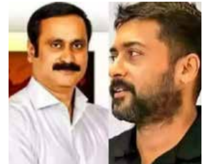
திரைப்படத்திலிருந்து நடிகர் சூர்யா நீக்கிவிட்டார். அந்த முத்திரை இடம்பெற்றதில் படத்தின் தயாரிப்பாளரும், கதாநாயகனுமான நடிகர் சூர்யாவிற்கு எந்த வகையிலும் தொடர்பு இல்லை. இருப்பினும் தங்கள் கட்சியைச் சார்ந்தவர்கள் நடிகர் சூர்யாவைத் தொடர்ந்து விமர்சித்து வருவது எந்த வகையிலும் நியாயம் இல்லை. இந்தச் செயல் மிகவும் வருத்தமளிக்கிறது" என தமிழ்நாடு திரைப்படத் தயாரிப்பாளர்கள் சங்கம் தெரிவித்துள்ளது.

அனுப்பப்பட்டுள்ளது. இந்நிலையில் நடிகர் சூர்யாவைத் தொடர்ந்து விமர்சித்து வருவது எந்த வகையிலும் நியாயம் இல்லை என்று உஷா ராஜேந்தர் தலைமையிலான தமிழ்நாடு திரைப்படத் தயாரிப்பாளர்கள் சங்கம் அன்புமணிக்குக் கண்டனம் தெரிவித்துள்ளது. இது தொடர்பாக தமிழ்நாடு திரைப்படத் தயாரிப்பாளர்கள் சங்கம் வெளியிட்ட அறிக்கை: "நடிகர் சூர்யாவின் நடிப்பில் வெளிவந்த 'ஜெய் பீம்' திரைப்படத்தில் தொழில் நுட்பக் கலைஞர்களால் காண்பிக்கப்பட்ட தங்கள் கட்சியின் முத்திரையை நீங்கள் அடையாளப்படுத்தி அதை நீக்க வேண்டும் என வேண்டுகோள் வைத்தீர்கள். அந்தக் காட்சி தொழில் நுட்பக் கலைஞர்களின் தவறான புரிதலால் இடம்பெற்றுள்ளதை அறிந்து தங்களின் உணர்வுகளுக்கு மதிப்பளித்து அந்தக் காட்சியை உடனடியாக