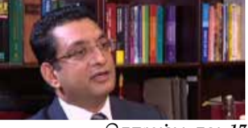
கொழும்பு, நவ. 17

தீப்பற்றியதன் பின்னர் மூழ்கிய "எக்ஸ் - பிரஸ் பேர்ஸ்" கப்பலிலிருந்து எண்ணெய் கசிவைத் தடுக்க எடுக்கப்பட்டுள்ள நடவடிக்கைகள் தொடர்பான கலந்துரையாடல் நடைபெற்றது.