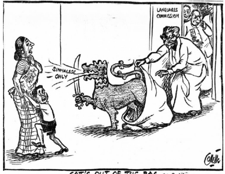
CAT'S OUT OF THE BAG 20. 11. 2021