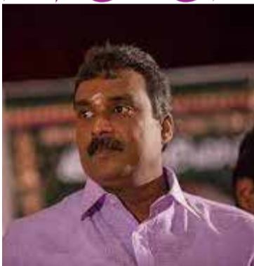
வுள்ளதாகவும் சுகாதாரத் துறையினர் குறிப்பிட்டனர்.

அவருடன் பணியாற்றும் 15 உத்தியோகத்தர்களிடம் பி.சி.ஆர். பரிசோதனை முன்னெடுக்கப்பட