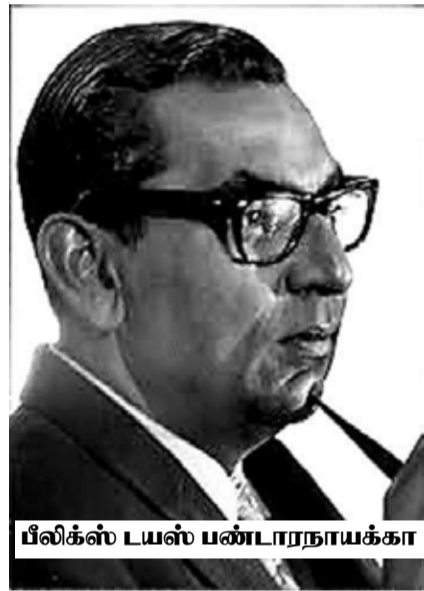
பீலிக்ஸ் டயஸ் பண்டாரநாயக்கா