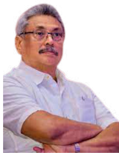
வரவு - செலவுத் திட்ட விவாதம் முடிவடைந்த பின்னர், அமைச்சரவையில்

மாற்றத்தை ஏற்படுத்துவதற்கு ஜனாதிபதி கோட்டாபய ராஜபக்ஷ திட்டமிட்டுள்ளார் எனத் தகவல்கள் தெரிவிக்கின்றன.