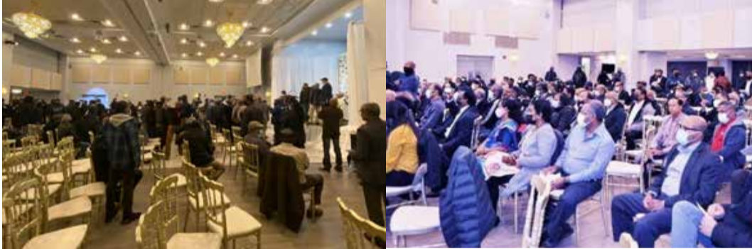
ரொறன்ரோ, நவம்பர் 22

சுமந்திரன் பேசிய கூட்டம் கனடாவில் குழப்பப்பட்டது கும்பலாகக் கூடியோர் கூச்சல்