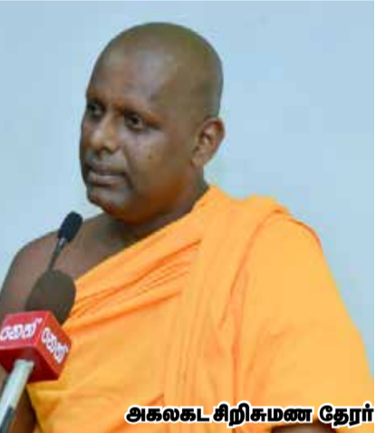
அகலகட சிறிசுமண தேரர்

பன்முகத்தன்மை கொண்ட நாட்டில் நீதியான நல்ல ஆட்சி அமையவேண்டுமானால் அங்கு வாழும் எல்லா இனத்தவர்களும் மதத்தவரும் சமமான உரிமைகளை அனுபவித்து, பாகுபாடற்ற போக்குகளிலிருந்தும் விரோத மனப்பான்மை கொண்ட சட்டங்களிலிருந்தும் பாதுகாக்கப்பட வேண்டும். இதற்கான முழு ஆதரவ்