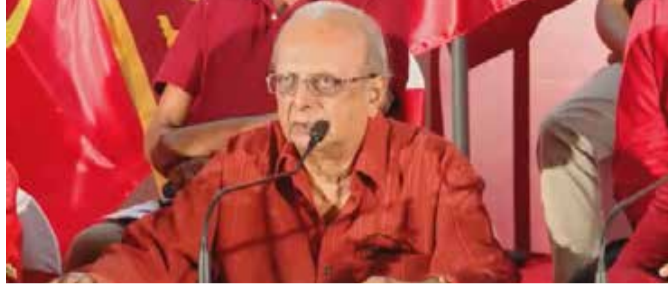
இலங்கைக்கு பைஸர் தடுப்பூசியை இறக்குமதி செய்வதையிலுமான எவ் குறைத்துக்கொள்ளுமாறும், மாற்று தடுப்பூசிகளை இறக்குமதி செய்ய நடவடிக்கை எடுக்குமாறும் அவர் கோரிக்கை விடுத்துள்ளார்.

கொழும்பு, நவ. 22 இலங்கையில் பைஸர் தடுப்பூசி செலுத்துவதன் ஊடாக, தேவையற்ற பாதிப்புக்களை ஏற்படுத்தும் அபாயம் காணப்படுவதாக எச்சரிக்கை விடுக்கப்பட்டுள்ளது. நாடாளுமன்ற உறுப்பினரும், வைரஸ் தொடர்பான விசேட நிபுணருமான பேராசிரியர் திஸ்ஸ விதாரண இந்த விடயத்தைத் தெரிவித்துள்ளார். பைஸர் தடுப்பூசியின் செயற்பாடு தொடர்பில் விஞ்ஞான ரீதியில் சந்தேகம் நிலவுவதாகவும் அவர் குறிப்பிட்டுள்ளார். பைஸர் தடுப்பூசி, கொரோனாப் பரவலுக்கு பின்னரான காலத்திலேயே முதல் தடவையாக பயன்படுத்தப்பட்டுள்ளதாகவும் அவர் தெரிவித்துள்ளார். இதன்காரணமாகவே தனக்கு இந்தத் தடுப்பூசி தொடர்பில் சந்தேகம் நிலவுவதாக அவர் சுட்டிக்காட்டியுள்ளார்.