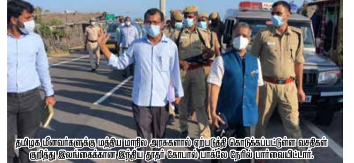
தமிழக மீனவர்களுக்கு முத்திய மாநில அரசுகளால் ஏற்படுத்தி கொடுக்கப்பட்டுள்ள வசதிகள் குறித்து இலங்கைக்கான இந்திய தூதர் கோபால் பாக்லே நேரில் பார்வையிட்டார்.