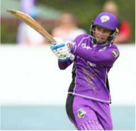
ரிகள், 3 சிக்ஸர்கள்) குவித்த போதும் 20 ஓவரில் 171/2 ஓட்டங்கள் மட்டும் எடுத்து தோல்வியடைந்தது. ஹர்மன்பிரீத் கவர், சிறந்த வீரர்களை ஆனார். மந்தனா சாதனை நேற்று முன்தினம் 114 ஓட்டங்கள் எடுத்த மந்தனா, ‘பிக் பாஷ்’ தொடரில் சதம் அடித்த முதல் இந்திய வீரர்களை என்ற பெருமையை பெற்றார். (ஐ)

சிட்னி, நவ. 20 ‘பிக் பாஷ்’ இருபது - 20 தொடரில் சதம் அடித்த முதல் இந்திய வீரர்களை என்ற பெருமையை ஸ்மிருதி மந்தனா பெற்றுள்ளார். அவுஸ்திரேலியாவில் பெண் களுக்கான ‘பிக் பாஷ்’ கிரிக் கெட் தொடர் நடக்கிறது. இதில், இந்திய அணியின் 8 வீரர்களை பங்கேற்கின்றனர். நேற்று முன்தினம் நடந்த லீக் போட்டியில் சிட்னி தண்டர்ஸ், மெல்பர்ன் ரெனிகேட்ஸ் அணிகள் மோதின. முதலில் களமிறங்கிய மெல்பர்ன் அணி 20 ஓவரில் 4 விக்கெட்டுக்கு 175 ஓட்டங்கள் எடுத்தது. ஹர்மன் பிரீத் கவர், 55 பந்தில் 81 ஓட்டங்களை விளாசினார். அடுத்து களமிறங்கிய சிட்னி அணிக்கு ஸ்மிருதி மந்தனா, 64 பந்துகளில் 114 ஓட்டங்கள் (14 பெளண்ட்