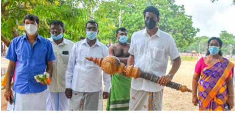
டம் நல்லூர் ஆலயத்தில் வைத்து மாநகர சபைக்கு செங்கோல் சம்பிரதாயபூர்வமாக கையளிக்கப்பட்டது.