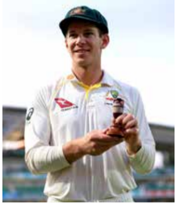
கிரிக்கெட் அணியின் தலைவர் பதவியில் இருந்து விலகுவதற்கான எனது முடிவை இன்று (நேற்று) அறிவிக்கிறேன். இது கடினமான முடிவு. ஆனால், எனக்கும் எனது குடும்பத்துக்கும் கிரிக்கெட்டுக்கும் சரியான முடிவு.

சிட்னி, நவ. 20 அவுஸ்திரேலியாவின் டெஸ்ட் அணித் தலைவர் ரிம் பெய்ன் தனது பதவியிலிருந்து திடீரென விலகியுள்ளார். ஆஷ் தொடருக்கான அணி அறிவிக்கப்பட்ட ஒரு சில நாட்களில், நேற்று அவர் நடத்திய செய்தியாளர் சந்திப்பில் அவர் இந்த அறிவிப்பை வெளியிட்டார். அவரின் இந்த விலகலுக்கு சக பெண் ஊழியர் ஒருவருக்கு பாலியல் சம்பந்தப்பட்ட மோசமான பதிவுகளை அவர் அனுப்பியமையே காரணம் என்று கூறப்படுகின்றது. செய்தியாளர்களிடம் நேற்று அவர் தெரிவித்த விடயங்கள் வருமாறு:- அவுஸ்திரேலிய டெஸ்ட்