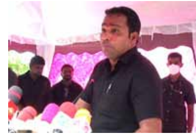
முன்னெடுக்கப்பட்டு வருகின்றது. 2020 ஆரம்ப காலத் தொடக்கம் ஞிணிதிடி19 தொற்றின் அசாதாரண சூழ்நிலை காரணமாக எமது நாடு பாரிய நெருக்கடிகளுக்கு மத்தியில் பொருளாதார முன்னேற்ற நடவடிக்கைகளை முன்னெடுக்க பாரிய சவால்களை சந்திக்க நேரிட்டது அரசின் நிலையான கொள்கை திட்டத்தினூடாக உள்ளூர் உற்பத்திகளை அதிகரிப்பதற்கான வேலைத்திட்டம்

இன்று நாடு பல்வேறு பொருளாதார நெருக்கடிகளுக்கு முகம் கொடுக்க கூடிய சூழ்நிலை உருவாகி இருக்கும் இந்த சந்தர்ப்பத்தில் எமது மக்கள் ஏற்பட்டிருக்கும் பொருளாதார நெருக்கடிகளுக்கு எதிர்த்து முகம் கொடுக்கக்கூடிய வகையில் உள்ளூர் உற்பத்திகளை அதிகரிப்பது மிக அவசியமான ஒன்றாக இருக்கின்றது இதற்காக கிராமிய மக்களின் பொருளாதார மாற்றத்தை ஏற்படுத்துவதற்காக உள்ளாட்டு மஞ்சள், இஞ்சி, பாசிப்பயறு, உளுந்து, உள்நாட்டு கிழங்கு, என மனை சார்ந்த பொருளாதார பயிற்சியை செய்கைகளை ஊக்குவிப்பதற்காக விசேட வேலைத் திட்டங்கள் பின்தங்கிய பிரதேச கிராமபிரதேச அபிவிருத்தி மற்றும் வீட்டு விலங்கின வளர்ப்பு மற்றும் சிறு பொருளாதார பயிற்சியை செய்கை மேம்பாட்டு அமைச்சின் ஊடாக