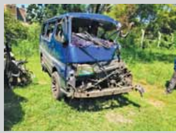
(ஹஸ்பர் ஏ ஹலீம்)

கதரல் கொடுவ பொலிஸ் பிரிவுக்குட்பட்ட கண்டி திருகோணமலை பிரதான வீதியில் இன்று (21) காலை இடம் பெற்ற வாகன விபத்தில் ஓடுவார் உயிரிழந்துள்ளதாக பொலிஸார் தெரிவித்தனர்.