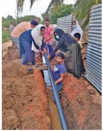
இணைந்து ரைஷா மகறாப் அவர்களும் ஈடுபட்டார்.

58 ஆசாத் நகர் மக்களின் குடிநீர் தேவையை நிறைவு செய்வதற்கான குழாய்கள் பொறுத்தும் நடவடிக்கையில் நேற்று (19) பொதுமக்களுடன்