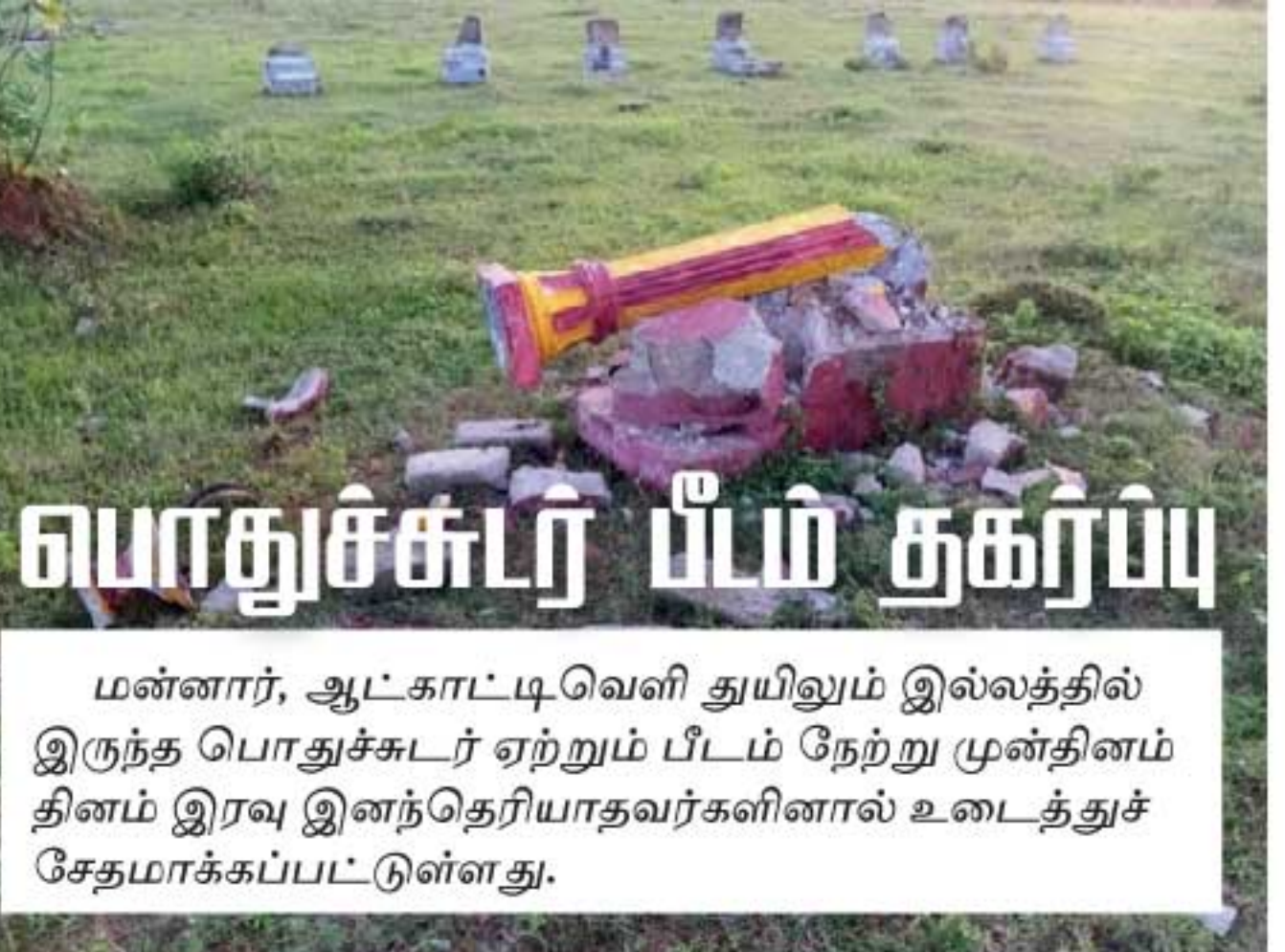
வயாதுச்சுடர் பீடம் குகர்ய்ய

மன்னார், ஆட்காட்டி. வெளி துயிலும் இல்லத்தில் இருந்த பொதுச்சுடர் ஏற்றுமீ பீடம் நேற்று முன்தினம் தினம் இரவு இனந்தெரியாதவர்களினால் உடைத்துச் சேதமாக்கப்பட்டுள்ளது.