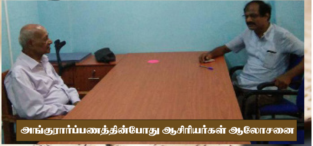
அங்குரார்ப்பணத்தின்போது ஆசிரியர்கள் ஆலோசனை