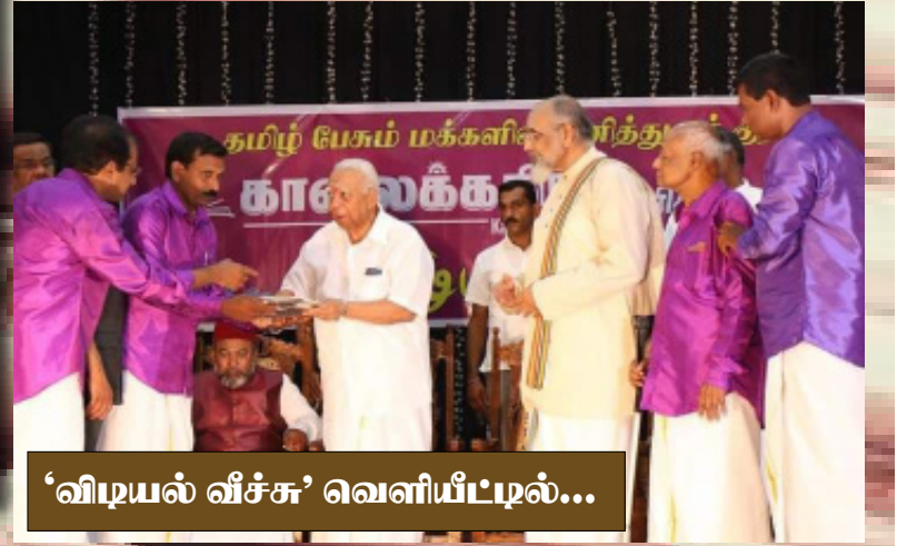
‘விடியல் வீச்சு’ வெளியீட்டில்...