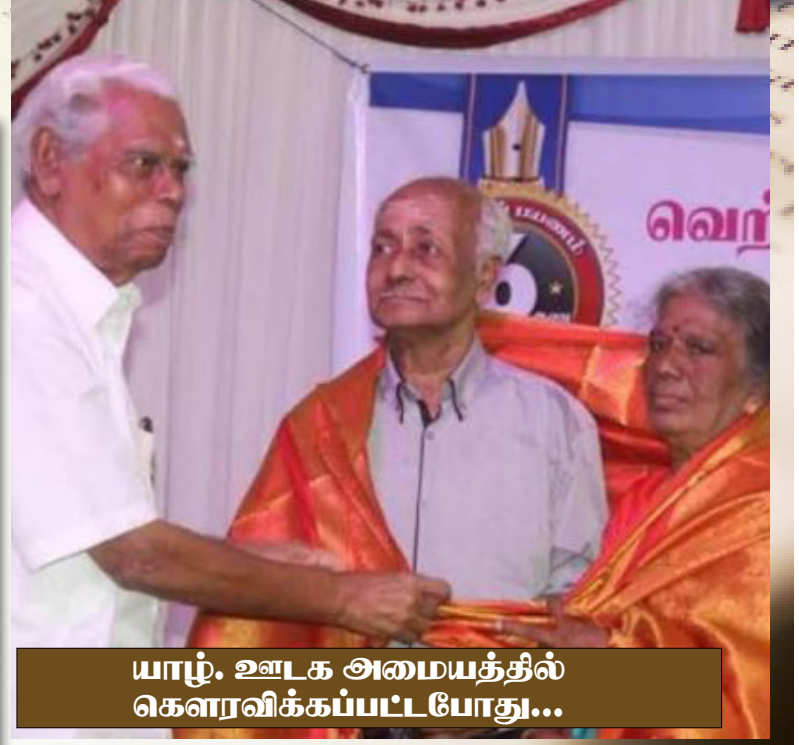
யாழ். ஊடக அமையத்தில் கௌரவிக்கப்பட்டபோது...