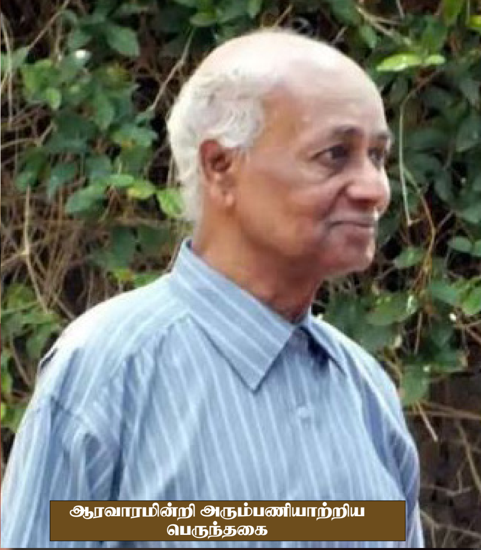
ஆரவாரமின்றி அரும்பணியாற்றிய பெருந்தகை