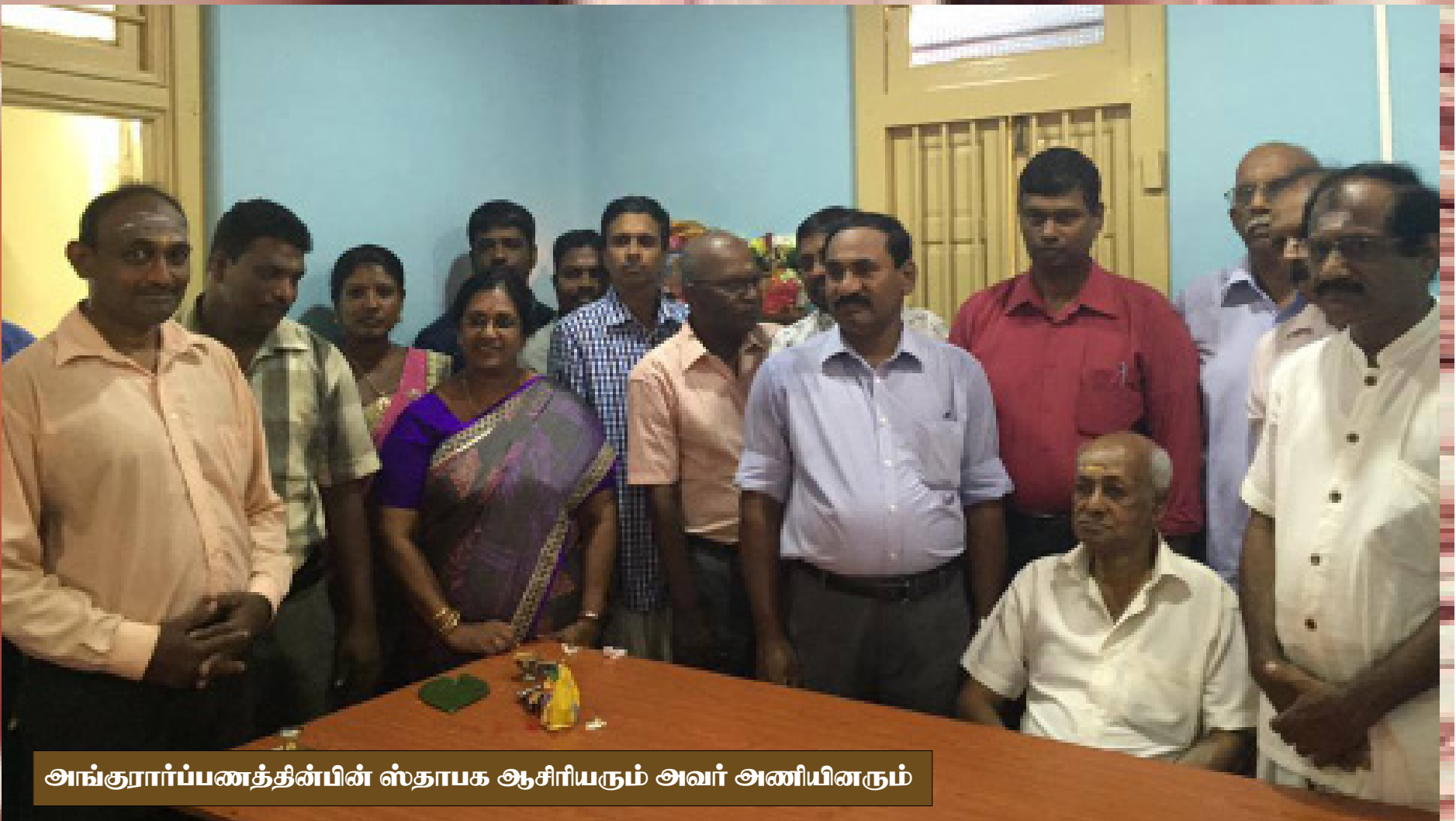
அங்குரார்ப்பணத்தின்பின் ஸ்தாபக ஆசிரியரும் அவர் அணியினரும்