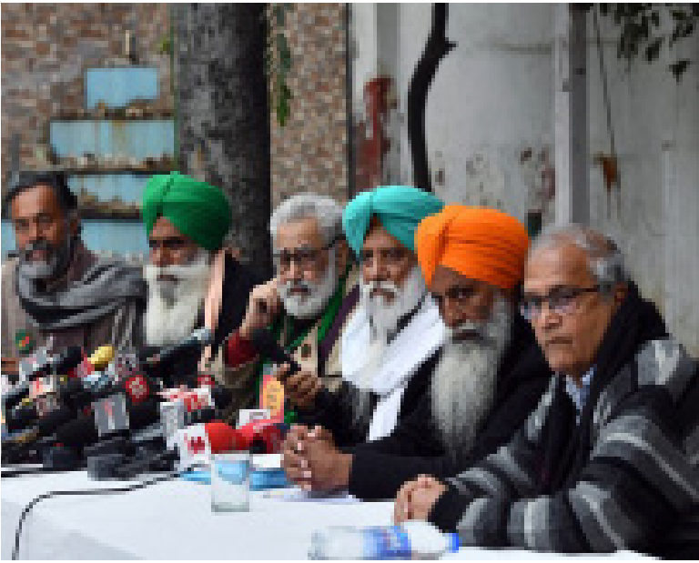
ஆறு முக்கிய கோரிக்கைகளை முன்வைத்து