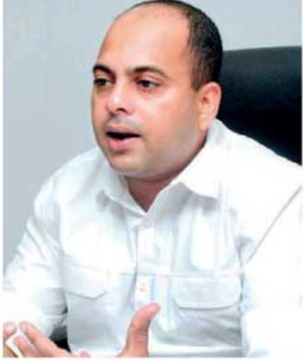
நாட்டை விட்டு வெளியேறும் நிலைக்கு இளைஞர்களை அரசாங்கம் தள்ளியுள்ளது. நனோ நைட் ரஜின் இறக்குமதியில் இடம்பெற்ற