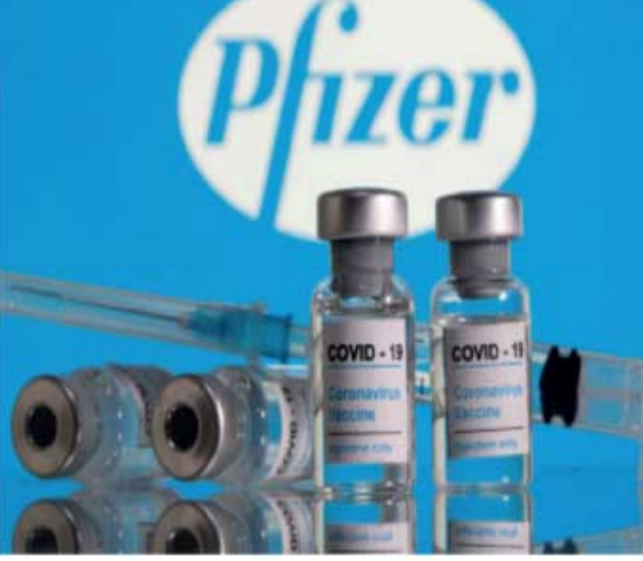
தொற்றாளர்களின் எண்ணிக்கையில் அதிகரிப்பு காணப்படுவதாகவும் சுகாதார சேவைகள் திணைக்கள வட்டாரங்கள் தெரிவிக்கின்றன. அத்துடன் குறித்த தடுப்பூசிகள் தற்போது இலங்கை மருந்தாக்கல் கூட்டுத்தாபனத்தால் களஞ்சியப்படுத்தப்பட்டு உள்ளன என்பதும் குறிப்பிடத்தக்கது.

தற்போது இலங்கையில் கொரோனா தடுப்பூசி செலுத்தும் பணி இடம்பெற்றுக் கொண்டிருக்கின்றன. இதேவேளை, அரசு மருந்தாக்கலல் கூட்டுத்தாபனத்தால் கொள்வனவு செய்யப்பட்ட 15 இலட்சம் பைலர் தடுப்பூசிகள் நாட்டுக்கு நேற்றுத் திங்கட்கிழமை காலை கொண்டுவரப்பட்டுள்ளன. இந்தத் தடுப்பூசிகள் நெதர்லாந்தில் இருந்து டுபாய் ஊடாக கட்டுநாயக்க விமான நிலையத்துக்கு நேற்று அதிகாலை கொண்டு வரப்பட்டுள்ளன. தற்போது கொரோனா கட்டுப்பாடுகள் தளர்த்தப்பட்டுள்ள போதும் கொரோனா