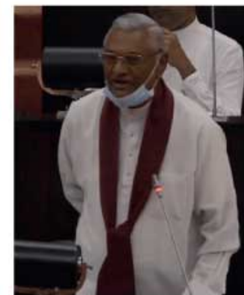
இருக்கிறது. இந்தக் காலத்தில் கொரோனா வைரஸ் பரவலும் ஏற்பட்டுள்ளதால் நாட்டுக்கு கிடைத்து வந்த வருமானம் வெகுவாகக் குறைவடைந்துள்ளது. இவ்வாறான நிலையில் இவ்வாறான ஒன்றிணைந்து நாட்டை கட்டியெழுப்ப வேண்டும் எனவும் அமைச்சர் சமல் ராஜபக்ஷ தெரிவித்தார்.

நிபுணர்களின் கருத்துகளுக்கு எதிர்க்கட்சியினர் செவிமடுக்க வேண்டும். நாட்டுக்கு அவசியமான புதிய கொள்கை ஒன்றையும் உருவாக்க வேண்டும் என அமைச்சர் சமல் ராஜபக்ஷ தெரிவித்தார். வரவு-செலவு திட்டத்தின் இரண்டாம் வாசிப்பு மீதான இறுதி நாள் விவாதத்தில் நேற்று (22) கலந்துகொண்டு உரையாற்றிய அவர், எதிர்க்கட்சி, நிபுணர்களின் கருத்துகளை செவிமடுக்க வேண்டும். நாட்டை கட்டியெழுப்புவதற்கு அனைவரும் ஒன்றிணைந்து நாட்டுக்கு அவசியமான புதிய கொள்கை ஒன்றை உருவாக்க வேண்டும் எனவும் தெரிவித்தார். நாடு மோசமான நிலையில்