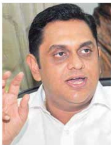
ஊழல் மோசடிகள் இடம்பெற்றிருந்ததாகவும், அதில் எனக்கு தொடர்பிருப்பதாகவும் குற்றம் சுமத்தியிருந்தார். நனோ நைட் ரஜின் உரத்தை இந்தியாவிலிருந்து இறக்குமதி செய்து, அதனை விவசாயிகளுக்கு விநியோகிக்கும் செயற்பாடுகளை அரசாங்கம் நிறுவுவதற்கான கொடும்பு கொடும்பு உர கம்பனியே

நனோ நைட் ரஜின் உர இறக்குமதியில் இடம்பெற்றதாகக் கூறும் மோசடியில் தனக்கு எந்தவிதமான தொடர்புகளும் இல்லை என இராஜாங்க அமைச்சர் சஷீந்திர ராஜபக்ஷ தெரிவித்துள்ளார். பாராளுமன்றத்தின் நேற்றைய (22) அமர்வில் கலந்துகொண்டு சிறப்புரிமை மீறல் பிரச்சினையை முன்வைத்து உரையாற்றும்போதே அவர் மேற்கண்டவாறு தெரிவித்தார். இதன்போது தொடர்ந்து உரையாற்றிய அவர், கடந்த வார பாராளுமன்ற அமர்வில் உரையாற்றியிருந்த ரோஹினி கவிரத்ன எம். பி, நனோ நைட் ரஜின் உர இறக்குமதியில்