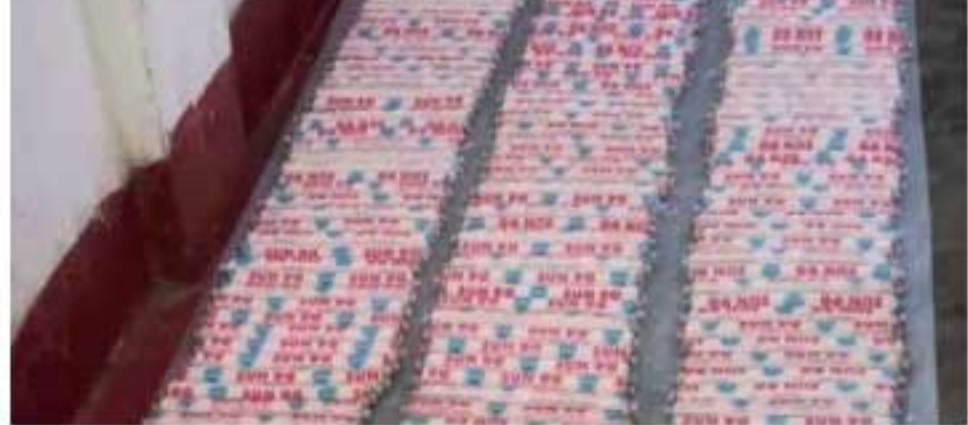
மன்னார் வளைகுடா கடல் வழியாக இராமநாதபுரம், தூத்துக்குடி மாவட்ட கடலோரத்தில் இருந்து ஷெல்ட்டிங் குச்சிகளை மன்னாருக்கு கடத்தி சென்றிருக்க கூடும். சமீப காலமாக இந்திய கடற்படை, கடலோர கடற்படை, தமிழக சட்டம்

மன்னாரில் 8 ஆயிரம் ஷெல்ட்டிங் குச்சிகளை பொலிஸார் பறிமுதல் செய்துள்ளனர். மன்னார் கடற்கரையில் பதுக்கி வைத்திருந்த 40 பார்சலில் 8 ஆயிரம் ஷெல்ட்டிங் குச்சிகளை பொலிஸார் பறிமுதல் செய்தனர். ஷெல்ட்டிங் குச்சிகளை தமிழகத்தில் இருந்து கடத்தி வந்ததாகவும், இதுதொடர்பான கடத்தல்காரர்கள் மீது நடவடிக்கை எடுக்கும்படி தமிழக பொலிஸாரிடம், பொலிஸார் வலியுறுத்தினர். பாக்கிஸ்தானி கடல்,