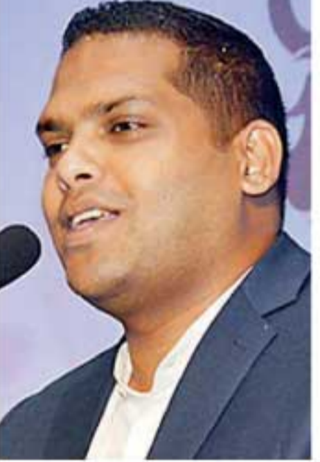
எழுப்பினார். சிஸ்டத்தை மாற்றுவதாகக் கூறி ஆட்சிக்கு வந்த ஜனாதிபதி டட்டலியிடம் அடிபணிந்துள்ளார். உரப் பிரச்சினையால் நுவரெலியாவில் மரக்கறி தட்டுப்பாடு ஏற்பட்டுள்ளது. அடுத்த வருடம் ஜனவரி மாதம் வரும்போது சாப்பிடுவதற்கு வழியில்லாதுபோகும் எனவும் எச்சரித்தார். இரசாயன உரத்துக்கு தடை விதிப்பது நல்ல விடயம். ஜனாதிபதி நல்லதையே செய்ய முயற்சிக்கிறார். ஆனால் எதையும் செய்வதற்கென்று ஒரு முறையொன்று இருக்கிறது எனவும் தெரிவித்தார். விவசாயிகள், ஆசிரியர்கள், அரசு ஊழியர்கள் எனத் தனக்கு வாக்களித்தவர்களையே அரசாங்கம் முதலில் கல்டத்தில் தள்ளியுள்ளது என்றார்.

சாருக்கும், தற்போதைய அரசாங்கத்துக்கும் பைத்தியம் பிடித்திருப்பதாக ஐக்கிய மக்கள் சக்தியின் பாராளுமன்ற உறுப்பினர் ஹரீன் பெர்ணான்டோ தெரிவித்தார். வரவு செலவு திட்டத்தின் இரண்டாம் வாசிப்பு மீதான இறுதி நாள் விவாதத்தில் நேற்று (22) கலந்துகொண்டு உரையாற்றிய அவர், சிஸ்டத்தை மாற்றுவதாகக் கூறிகொண்டு ஆட்சிக்கு வந்த ஜனாதிபதி கோட்டாபய ராஜபக்ஷ, டட்டி சிறிசேனவிடம் அடிபணிந்துள்ளார். கொரோனா வைரஸ் தொற்றே நாட்டின் தற்போதைய நிலைக்குக் காரணம் என கூறுகிறார்கள். உலகக் நாடுகள் அனைத்தும் கொரோனா வைரஸ் நெருக்கடிக்கு முகம் கொடுத்திருந்தன. எந்த நாட்டிலாவது சமையல் எரிவாயு