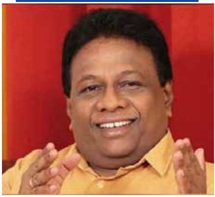
(முதலாம் பக்கத் தொடர்ச்சி)

இது தொடர்பில், ஊடகத்துறை அமைச்சர் டலஸ் அழகப்பெரும் சமர்ப்பித்த யோசனைக்கு அமைச்சரவை அங்கீகாரம் வழங்கியுள்ளது.