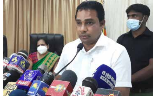
இழப்புகளை சந்தித்தவர்கள் சட்டத்துக்கு உட்பட்டு வீடுகளில் அனுஷ்டிக்க முடியும். அவர்களுக்கு நாங்கள் இந்த இடத்திலே ஆறுதல் சொல்ல விரும்புகிறேன். - என்றார்.

இந்நிகழ்வுக்குப் பின்னர் நினைவேந்தல் தொடர்பாக நீதிமன்றத் தடையுத்தரவு பெறப்படுகின்றமை தொடர்பாக ஊடகவியலாளர்கள் இராஜாங்க அமைச்சரிடம் கேள்வி எழுப்பிய பொழுது, யுத்தத்தால் பாதிக்கப்பட்டவர்கள்,