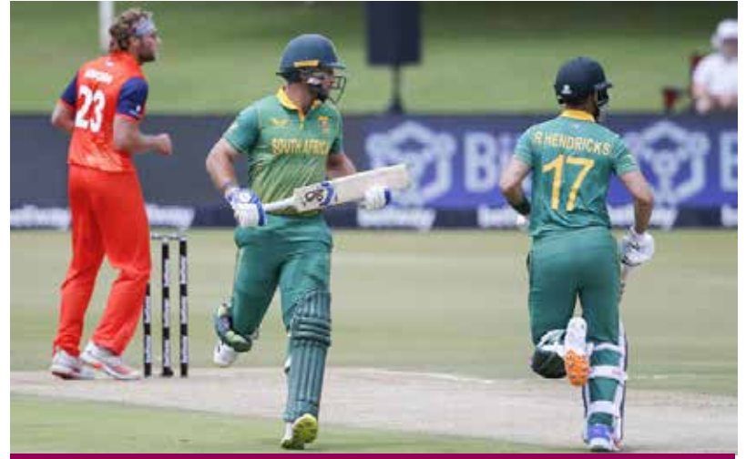
புதிய வகை கொரோனா வைரஸ் அச்சுறுத்தல்