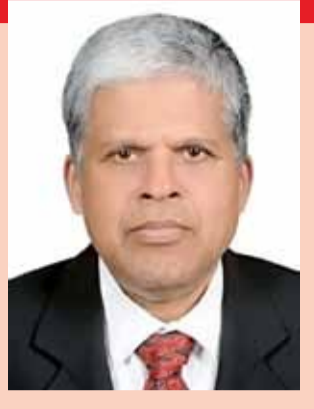
கவனம் செலுத்துவதோடு ஆட்சியாளர் பாலம் ஆவன செய்ய வேண்டும் எனவும் மேலும் வலியுறுத்திக் கேட்டுக் கொள்கின்றோம் என குறிப்பிடப்பட்டுள்ளது.

கேட்டுக் கொள்கின்றோம். கிண்ணியா - குறிஞ்சாக்கேணி போல, மூதூர் பிரதேச செயலாளர் பிரிவில் உள்ள வேதத்தீவு, ஈச்சிலம்பற்றுப் பிரதேச செயலாளர் பிரிவில் உள்ள இலங்கைத்துறை - மாதவிபுரம் - இலங்கைத்துறை - முகத்துவாரம் மற்றும் கறுக்காமுனை - புனையடி - இலங்கைத்துறை - முகத்துவாரம் ஆகிய இடங்களில் மாணவர்கள் நாள்தோறும் ஆறுகளைக் கடந்தே பாடசாலைக்குச் செல்கின்றனர். இந்த இரண்டு இடங்களிலும் உரிய அதிகாரிகள் கூடுதல்