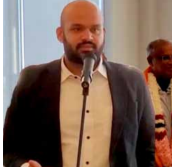
அதிலே இஸ்லாமிய சகோதரர்கள் மத்தியிலேயே அதிக வர

வேற்பு கிடைத்துள்ளது. தமிழ் மக்களுக்காக குரல் கொடுக்கும் பொது எங்களை பாராட்டுவதனை விடவும், இல்லாமியர்களுடைய பாராட்டுக்கள் அதிகமாக வருகின்றது. எனக்கு முன்னர் உரையாற்றிய ஒருவர் சொன்னார் நாங்கள் அவர்களுக்கு வாக்களிப்போவதில்லை என்று. அது உண்மைதான். என்னை பொறுத்தவரையில் நான் அந்த வாக்குகளை எதிர்பார்த்து எதனையும் செய்யவில்லை எனக் குறிப்பிட்டுள்ளார்.