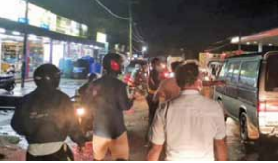
(திருகோணமலை ரவீக் பாயில்)

திருகோணமலை தலைமையக பொலிஸ் பிரிவுக்குட்பட்ட கண்டி வீதி லிங்கநகர் பிரதேசத்தில் பிரதான வீதியில் குடிபோதையில் அட்ட