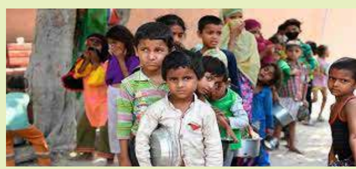
எரிபொருள், சுகாதாரம், குடிநீர், மின்சாரம், வீடு, சொத்துக்கள் மற்றும் வங்கிக் கணக்குகள் போன்ற 12 அம்சங்களின் அடிப்படையிலும் இந்தப் பட்டியல் தயாரிக்கப்பட்டுள்ளது.

னர் என நிதி ஆயோக் அறிக்கை கூறுகிறது. இந்தப் பட்டியலில், கேரளா (0.71 சதவீதம்), கோவா (3.76 சதவீதம்), சிக்கிம் (3.82 சதவீதம்), தமிழ்நாடு (4.89 சதவீதம்) மற்றும் பஞ்சாப் (5.59 சதவீதம்) ஆகிய மாநிலங்களின் வறுமைக் குறியீடுகள் குறைந்த அளவிலேயே உள்ளன. இந்த மாநிலங்கள் யாவும் வறுமையிடுகின்ற மாநிலங்களுக்கான பட்டியலில் கடைசி இடங்களைப் பிடித்துள்ளன. சுகாதாரம், கல்வி மற்றும் வாழ்க்கைத் தரம் ஆகியவற்றை அடிப்படையாகக் கொண்டு இந்தப் பட்டியல் தயாரிக்கப்பட்டுள்ளது. மேலும், ஊடடச்சத்து, குழந்தைகள் மற்றும் இளம்பருவ இறப்பு, பிரசவத்திற்கு முந்தைய பராமரிப்பு, பள்ளிப்படிப்பு ஆண்டுகள், பள்ளி வருகை, சமையல்