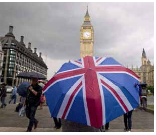
விதித்து அந்த 6 நாடுகளையும் சிவப்புப் பட்டியலில் பிரிட்டன் இணைத்துள்ளது. இந்த 6 நாடுகளில் இருந்து பிரிட்டன் வருவோர், அரசு அங்கீகாரம் பெற்ற ஹோட்டலில் 10 நாட்கள் தனிமைப்படுத்தப்பட்டு கண்காணிக்கப்பட வேண்டும் எனவும் தெரிவிக்கப்பட்டுள்ளது.

தென் ஆபிரிக்காவில் புதிதாக உருமாற்றம் அடைந்த பி.1.1.529 என்ற வகை கொரோனா வைரஸ் கண்டறியப்பட்டுள்ளது. இந்த வைரஸின் பரவுதல் வேகமும், வீரியமும் மிக அதிகமாக உள்ளது. இந்த புதிய வகை வைரஸானது, அதிக பாதிப்பை ஏற்படுத்தும் என விஞ்ஞானிகள் எச்சரித்துள்ளனர். புதிய வகை வைரஸுக்கு எதிராக தடுப்பூசி சியின் செயல் திறனும் மிகக் குறைவாக உள்ளதாக நிபுணர்கள் தெரிவித்தனர். இதனால், உலக நாடுகள் கூடுதல் விழிப்புடன் கண்காணிக்கத் தொடங்கியுள்ளன. அந்த வகையில், புதிய வகை வைரஸ் பிரிட்டனில் பரவாமல்தடுக்கும் நடவடிக்கையை அரசு மேற்கொண்டுள்ளது. இதன் ஒரு பகுதியாக தென் ஆபிரிக்கா, நமிபியா, ஜிம்பாப்வே, போதஸ் வானா, லெசோத்தோ, எஸ்வாதினி (ஸ்வாசிலாந்து) ஆகிய தெற்கு ஆபிரிக்க நாடுகளுக்கான விமான சேவையை பிரிட்டன் அரசு தற்காலிகமாக ரத்து செய்துள்ளது. மேலும், கடும் பயணக் கட்டுப்பாடுகளை