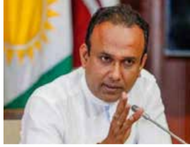
அமைச்சரவை முடிவுகளை அறிவிக்கும் ஊடகவியலாளர் சந்திப்பு நேற்று நடைபெற்றது. இதில் கருத்து வெளியிடும்போதே