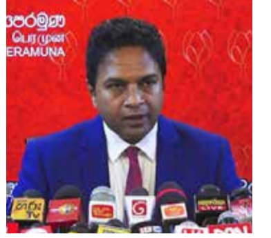
அரசுக்குள் இருந்து கொண்டு, சிறப்புரிமைகளை அனுபவித்தபடியே அவர்கள் விமர்சிக்கின்றனர். அவர்களின் கொள்கை என்னவென்பது புரியவில்லை” - என்றார். (இ)

கட்சியினர் முயற்சிக்கின்றனர். உரப்பிரச்சினையின்போது அரசுக்கு எதிர்ப்பு ஏற்பட்டது. இந்நிலையில், இந்தத் திட்டத்துக்கு தாமதம் எதிர்ப்பு என சுதந்திரக் கட்சி 'பல்டி' அடித்தது. சிலவேளை இந்தத் திட்டம் வெற்றியளித்திருந்தால் அதற்கும் தான்தான் காரணம் என மைத்திரிபால சிறிசேன உரிமை கோரி இருப்பார்.