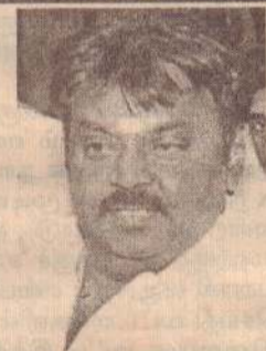
அதன் விவரம் வருமாறு:-

இலங்கை விவகாரத்தைக் கண்டித்து தி.மு.க. எம்.பி.க்கள் ராஜினாமாக் கடிதம் அளித்துள்ளமையை மத்திய அரசுக்கு விடுக்கப்பட்ட மிரட்டலாகக் கருதலாமா என்று கேட்டதற்கு, ராஜினாமா கடிதத்தின் மூலம் அவர்கள் தங்களது உணர்வுகளைத்தான் வெளிப்படுத்தியுள்ளனர் - என்றார்.