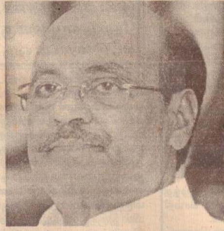
தடுத்து நிறுத்த முடியும்.

இதுகுறித்து காங்கிரஸ் தலைமை சரியான நேரத்தில் முடிவு செய்யும். காங்கிரஸ் ஒரு தேசியக் கட்சி என்ற முறையில் தலைமையிடம் கேளாமன் முடிவு செய்து கொடுக்க வேண்டுகிறேன். இதை அனைத்துக் கட்சி கூட்டத்தில் தெரிவித்தேன். இலங்கைத் தமிழர் நலனைக் காங்கிரஸ் அக்கறை கொண்டுள்ளது என்றார்.