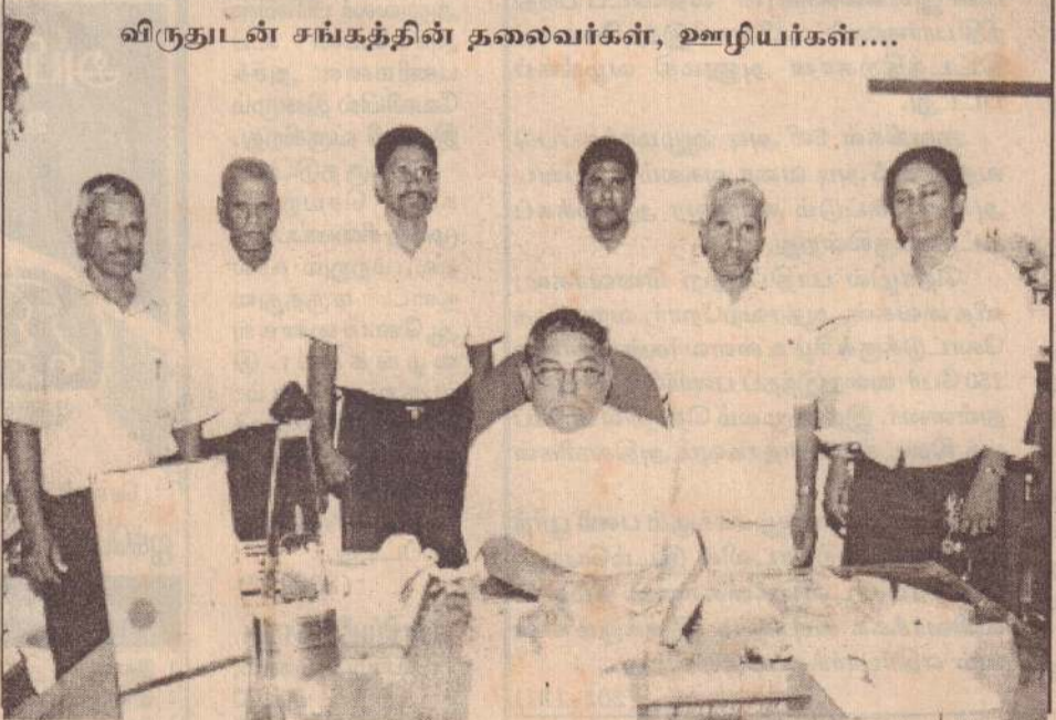
விருதுடன் சங்கத்தின் தலைவர்கள், ஊழியர்கள்....