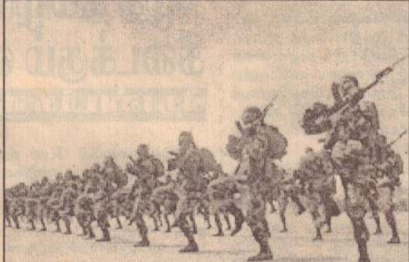
முன்னரங்குகளில் பலத்த சண்டை வன்னியில் பல முன்னரங்க நிலைகளிலும் பலத்த சண்டைகள் நடைபெற்று வருவதாக தகவல்கள் கிடைத்து வருகின்றன. வெலி ஓயா பகுதியில் படையினர் மேலும் சில இடங்களை மீளவும் கைப்பற்றியுள்ளனர்.

தொடர்பான தகவல் வந்தது. அநுராத புரத்தில் கையாடப்படையினர் சிகிச்சை பெறும் அநுராதபுரம் ஆஸ்பத்திரி ஒன்றின் மீது தாக்குதல் நடத்தப்படவிருப்பதாக வந்த தகவலை அடுத்து அப்பகுதியில் மின்சாரம் துண்டிக்கப்பட்டு இருட்டடிப்பு செய்யப்பட்டது. ஆனால் அது தவறான தகவல் என்று பின்னர் தெரியவந்தது. அடையாளம் தெரியாத இராணுவ முக்கியத்துவம் வாய்ந்த தளம் ஒன்றின்மீது தாக்குதல் நடத்துவதற்கான திட்டம் செயல்படுத்தப்படவிருப்பதான ஒரு தகவல் கடந்த செவ்வாய்க்கிழமை அதிகாரிகளால் வெளியிடப்பட்டு வடக்கிலும் கிழக்கிலும் எல்லா இராணுவத்தளங்களும் உஷார்படுத்தப்பட்டு எதற்கும் தயார் நிலையில் வைக்கப்பட்டன. ஆனால் அப்படியான தாக்குதல் எதுவும் இடம் பெறவில்லை.