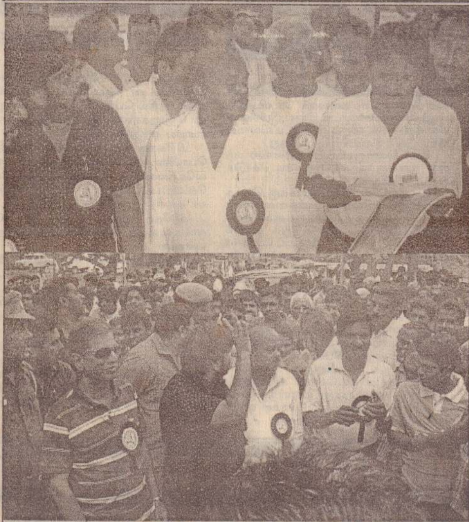
இராமேஸ்வரத்தில் திரைஉலகினர் நேற்று நடத்திய போராட்டத்தின் போது எடுக்கப்பட்ட படங்கள்.