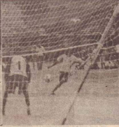
உடுவில் கல்விக்கோட்டப் பாடசாலைகளின் 16 வயதுப் பிரிவு அணிகளுக்கு இடையேயான உதைபந்தாட்ட இறுதியாட்டத்தில், ஏழாலை ஸ்ரீ முருகன் வித்தியாலயமும், கந்தரோடை தமிழ்க்கந்தையா வித்தியாலயமும் மோதிக்கொள்வதைப் படங்களில் காணலாம்.