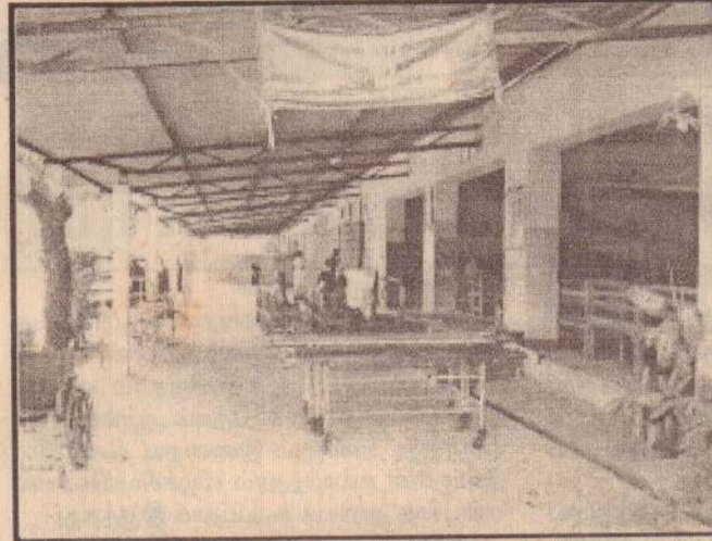
சாவகச்சேரி ஆதார வைத்தியசாலை அபிவிருத்திச் சபையினரால் வெளிநோயாளர் பிரிவு, பெண்கள் விடுதி ஆகியவற்றுக்கு முன்பாக அமைக்கப்பட்ட 150 அடி நீளமான மண்டபத்தினை படத்தில் காணலாம். அபிவிருத்திச் சபையினரால் நடத்தப்பட்ட கொடிவாரத்தின்போது சேகரிக்கப்பட்ட நிதியில் இம்மண்டபம் அமைக்கப்பட்டமை குறிப்பிடத்தக்கது.

ஆயிரம் ரூபாவும் ஒதுக்கப்பட்டுள்ளது. இவற்றுள் வண்ணை சிவன் முன்பள்ளிக்கு மலசலகூடம் அமைக்க மேலதிகமாக 50 ஆயிரம் ரூபாவும் நாவாந்துறை மலரும் மொட்டுக்களுக்கு பாடசாலை திருத்தம், வேலி திருத்தம் என்பவற்றுக்கு மேலதிகமாக ஒரு லட்சத்து ஐம்பதாயிரம் ரூபாவும் ஒதுக்கப்பட்டுள்ளது. சுண்டுக்குளி தெற்கு கிறீன் பீல்ட் சனசமூக நிலைய புனரமைப்புக்கும் இரண்டு லட்சத்து 50 ஆயிரம் ரூபாவும் ஒதுக்கீடு செய்யப்பட்டுள்ளது. (202-302)