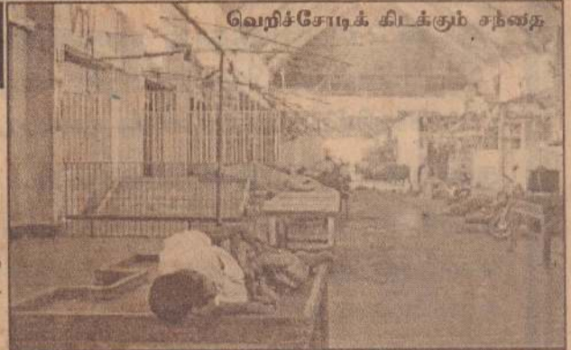
வெறிச்சோடிக் கிடக்கும் சந்தை

சென்னை உட்பட அனைத்து நகரங்களிலும் கடைகள் மூடப்பட்டிருந்தன. மனிசைக் கடைகள், தேநீர்க்கடைகள், காய்கறிக்கடைகள், சிறப்பு அங்காடிகள், ஐடிஎன் கடைகள் உட்படச் சகல வர்த்தக நிறுவனங்களும் முழுமையாக அடைக்கப்பட்டன. (15 ஆம் பக்கம் பார்க்க)