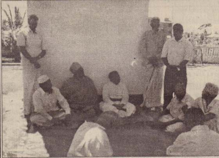
நேற்று நடைபெற்ற தந்தை செல்வாவின் நினைவுதின நிகழ்வில் எடுக்கப்பட்ட படங்கள் இவை. தந்தை செல்வாவின் நினைவுத் தூபியை முதலாவது படத்திலும் மும்மதத் தலைவர்களும் இணைந்து சர்வமதப் பிரார்த்தனையில் ஈடுபடுவதை இரண்டாவது படத்திலும், நிகழ்வில் கலந்துகொண்டோரில் ஒரு பகுதியினரை அடுத்துள்ள படத்திலும் காணலாம்.