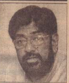
கொழும்பு, மே 31

அரசாங்கத்துக்கும் விடுதலைப் புலிகளுக்கும் இடையில் கைச்சாத்தான போர்நிறுத்த ஒப்பந்தம் குறித்துத் தீர்க்கமான முடிவு எடுக்கப்படவேண்டிய காலம் கனிந்துவிட்டது. ஒப்பந்தம் கைச்சாத்தான காலத்தில் நிலவிய சூழ்நிலைக்கும் இன்றைய தள நிலைமைக்கும் இடையில் பெரும் வேறுபாடு உள்ளது. ஆகையால், போர்நிறுத்த ஒப்பந்தத்தைத் தொடர்ந்து கடைப்பிடிப்பதா என்பது குறித்து அடுத்த வாரத்தில் விசேட பேச்சுவார்த்தை ஒன்றை நடத்தவுள்ளோம்.