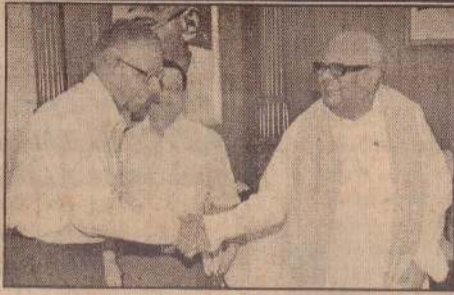
சென்னை, ஜூன் 1 இலங்கை அரசாங்கம் பாகிஸ்தானிடமிருந்தோ அல்லது சீனாவிடமிருந்தோ