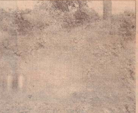
தூர்ந்து போன குளம்

முறை தேவையாக உள்ளது. குடாநாட்டின் சூழல் பாதுகாப்பிற்கு நீர்நிலைகளைப் பேணவேண்டியது முக்கிய தேவையாக உள்ளது. இது தொடர்பாக சமீப ஆண்டுகளில் சிறு விழிப்புணர்ச்சி ஏற்பாட்டிற்குப் பி