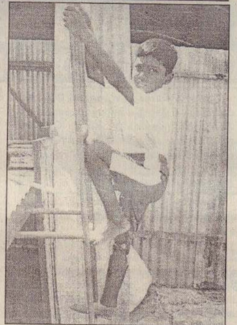
மூலப்பொருள்களைத் தடையின்றிப் பெற உதவுதல் போன்றவற்றில் உதவிக்கரம் நீட்டியுள்ள சர்வதேச செஞ்சிலுவைச் சங்கத்தினருக்கு எமது நிறுவனம் என்றென்றும் நன்றி கூறக் கடமைப்பட்டுள்ளது.

ஆரம்பத்தில் குறைந்தளவு மூலப்பொருள் கருடன் அலுவலினியத்தாலான செயற்கை அவ