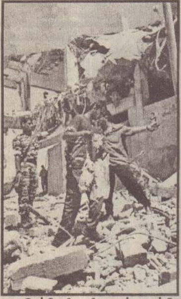
இஸ்ரேலிய விமானக் குண்டு வீச்சில் தகர்ந்துகிடக்கும் பலஸ்தீனக் கட்டடம்

லண்டன், ஜூலை 16 காஸா பிரதேசத்தில் உள்ள பலஸ் தீனக்கட்டமொன்றை இஸ்ரேலிய விமானங்கள் நேற்று குண்டு வீசித் தகர்த்தன. இந்தக் கட்டத்தில் பலஸ்தீனத் தீவிரவாதிகளின் வெடி பொருள் தொழிற்சாலை இயங்கி வந்ததாக இஸ்ரேலிய இராணுவம் கூறியுள்ளது. கான்பூனுஸ் நகரருகே உள்ள குராரா பகுதியில் இந்தத் தாக்குதல் நிகழ்ந்துள்ளது. இஸ்ரேலிய விமானப்படையின் 'அப்சே' ரக ஹெலிகொப்டர்களும் எப்-16ரக விமானங்களும் இந்தக் குண்டு