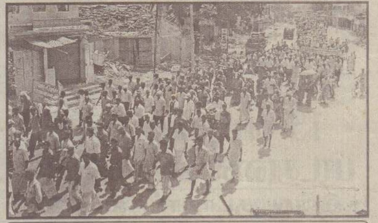
தென்மராட்சியில் நேற்று நடந்த பேரணியின்போது எடுக்கப்பட்ட படம்.

யாழ்ப்பாணம், ஜூலை 16 யாழ்ப்பாணம் பல்கலைக்கழக மாணவர் குழுக்களிடையே கடந்த மாதம் இடம்பெற்ற மோதல் சம்பவங்கள் தொடர்பான வாக்குமூலங்களைப் பெறுவதற்காக அந்தச் சம்பவங்களுடன் தொடர்புடைய மாணவர்களை யாழ்ப்பாணம் நிலையத்திற்குச் செல்லுமாறும் அவர்களின் பெயர், விராங்களை மன்றிற்கு அனுப்புவைக் குமாறும், இம்மாதம் முதலாம் திகதி (12ஆம் பக்கம் பார்க்க)