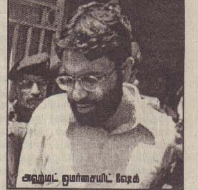
அஹமட் ஒமர்சையிட் ஷேக் இவ்வாறு மரணதண்டனை விதிக்கப்பட்ட அஹமட் ஒமர் தீப்பு வழங்கப்படுவதற்கு சிறிது நேரம் முன்னர் தெரிவித்ததாகத் கூறப்படுகிறது. (9)