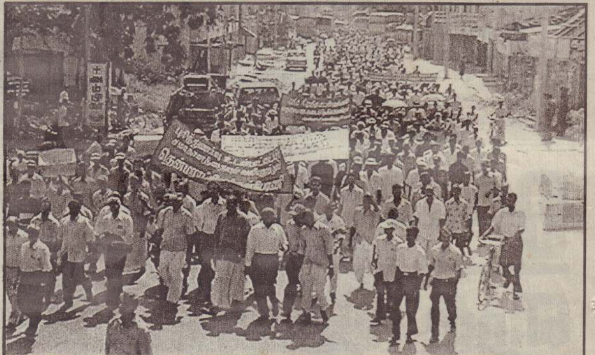
ஆயிரக்கணக்கானோர் கலந்துகொண்ட பேரணி சாவகச்சேரி பிரதேச செயலகத்தை நோக்கி நகரும் காட்சி.