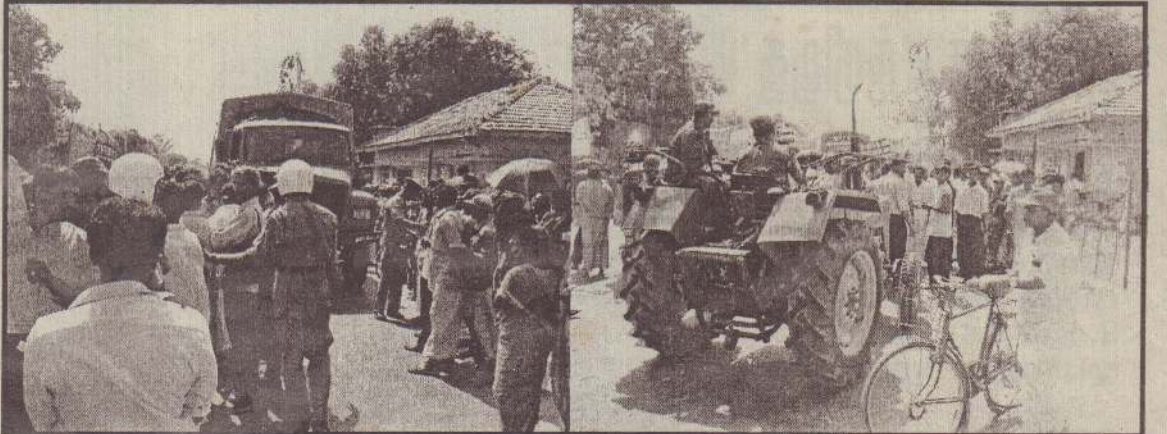
கிராம வாகனம் ஒன்றை பொதுமக்கள் வழிமறித்து நிற்பதையும், அவர்களைத் தாண்டி அவ்வாகனத்தைச் செல்ல விடுவதற்கு பொலீஸார் முயன்றுகொண்டிருப்பதையும் முதலாவது பிரதேச செயலகத்திற்கு முன்பாகச் செல்லும் பாணை பொதுமக்கள் போக்குவரத்துக்குத் தடை... அந்தப் பாதைக்குள் பேரணியில் வந்தவர்கள்... மறித்து நிற்கும் கிராம வாகனம் அடுத்த படத்திலும் காணலாம்.