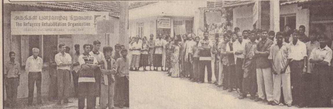
அகதிகள் புனர்வாழ்வு நிறுவன ஊழியர்களும் 'முயற்சி' தொழிற்பயிற்சி நிலைய மாணவர்களும்....