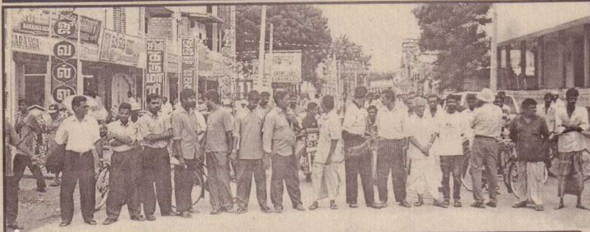
யாழ். கஸ்தூரியார் வீதியின் குறுக்கே வர்த்தக நிறுவனங்களின் பணியாளர்கள்....