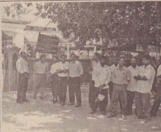
யாழ். பிரதேச செயலக ஊழியர்கள்...