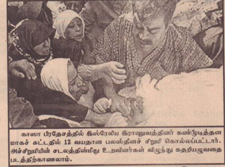
காலா பிரதேசத்தில் கிஸ்ரேலிய கிராணுவத்தினர் கண்முடித்தனமாகச் சுட்டதில் 12 வயதான பலஸ்தீனச் சிறுமி கொல்லப்பட்டார். அச்சிறுமியின் சடலத்தின்மீது உறவினர்கள் விழந்து கதறியழுவதை படத்திற்காணலாம்.