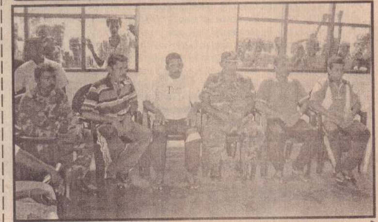
விடுதலைப் புலிகளால் நேற்று விடுவிக்கப்பட்ட படையினர் அறுவர்.