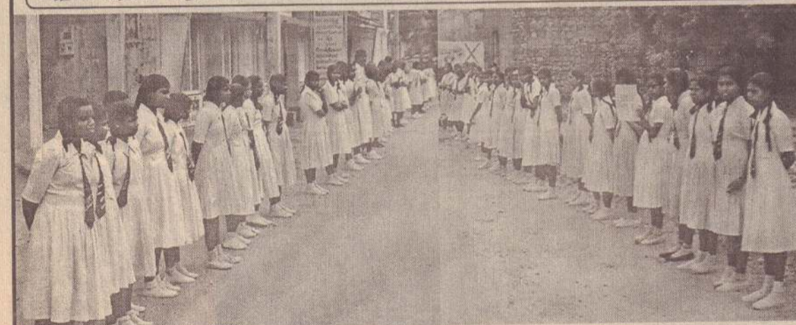
பிரதான வீதியில் பெரியகடைப் பகுதியில் வீதியின் இரு மருங்கிலும் நிற்கும் பாடசாலை மாணவிகள்...