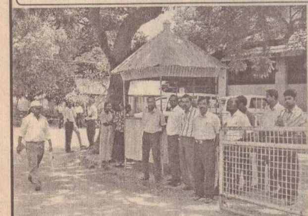
யாழ். செயலக ஊழியர்கள்....