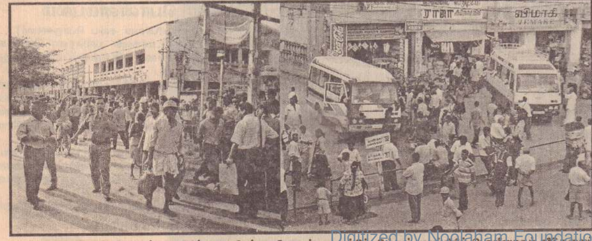
நேற்று யாழ்ப்பாணம் நல்லையப் பகுதியில் நடைபெற்ற கனோரத்தைக் கட்டுப்படுத்தும் முயற்சியில் இலங்கைப் புலிகளின் பிரமுகர்களும் ஈடுபட்டிருப்பதை முதலாவது படத்தில், இரண்டாவது படம் பணை நடுகைப் பகுதி கதைகளைப் பற்றி யாழ்ப்பாணம் நல்லையப் பகுதியில் காத்திருக்கும் பொதுமக்களை அடுத்துள்ள படத்திலும் காணலாம்.

சுமுகமான சூழ்நிலை இன்னமும் இங்கு ஏற்படவில்லை. சுமுகமான சூழ்நிலையை நோக்கியதாக இன்றைய நிலை உள்ளது என்று அரசு அதிபர் அதற்குப் பதிலளித்தார். ஜேம்ஸ் தொழில்நுட்ப நிறுவனம் பல செயற்பாடுகளை இங்கு மேற்கொண்டுள்ளது. இத்தப் பணி தொடர்ந்து இடம்பெறவேண்டும் என்று அரசு அதிபர் அவரிடம் கேட்டுள்ளார்.