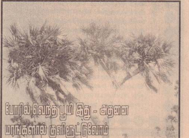
போரில் விவந்த பூமி கிது - அருவா மரங்களால் குளிர்மூட்டுவோம்

உதயவாக்கு பொறுமை கசக்கும் முல்லைக்காலை, சூனாலை அது வழங்குவதோடு இன்குடிப் புல்களை.