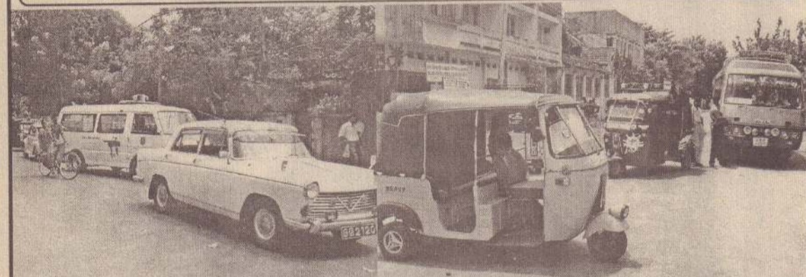
பிரதான வீதியில் யாழ். சிறைச்சாலையை அண்டிய பகுதியில் ஒருமணிநேரம் தரித்து நின்ற வாகனங்கள்...