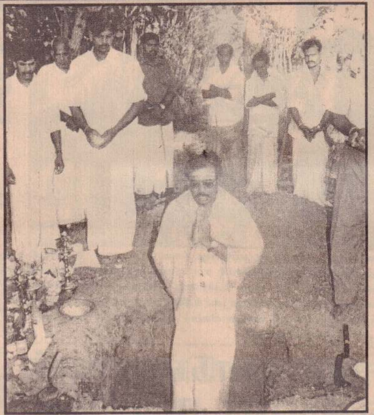
40 லட்சம் ரூபா செலவில் ஆவரங்கால் சீவன் கோயிலடியில் நறுவப்பலவுள்ள 'சீவசக்தி' கல்யாண மண்டபத்திற்கான அடிக்கல் நடுமீறா அண்மையில் நடைபெற்றது.