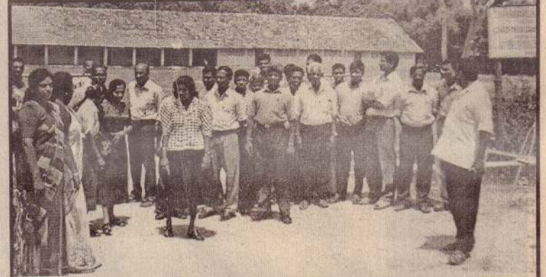
யாழ். வலயக் கல்வித் திணைக்கள ஊழியர்கள்...