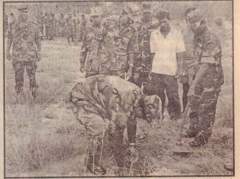
கைதடியில் நேற்றுப் படையினர் மேற்கொண்ட பணம் வீதை நாட்டும் செயற்பாட்டின்போது கிராணுவத்தினர் பணம் வீதைகளை நாட்டுவதைப் படத்தில் காணலாம்.