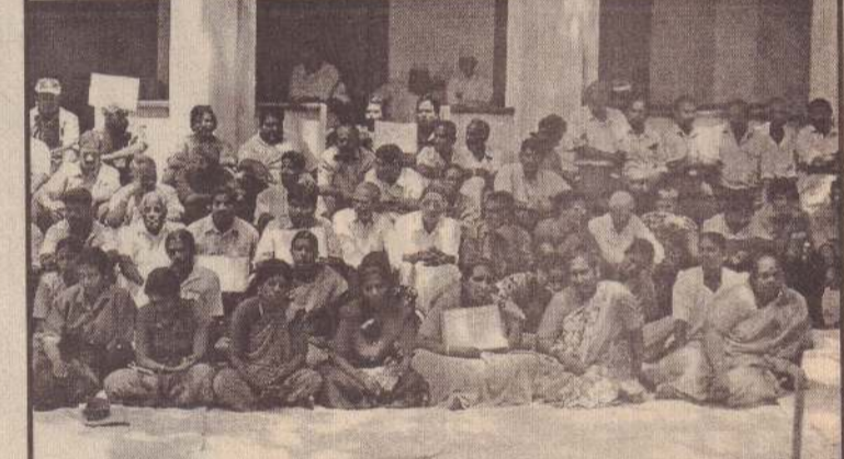
மனித உரிமைகள் ஆணைக்குழுவின் முன் யாழ்ப்பாணத்தில் உள்ள பொது அமைப்புக்களின் பிரதிநிதிகள் மற்றும் மதகுருமார் ஆகியோர் போராட்டத்தில் ஈடுபட்டபோது...