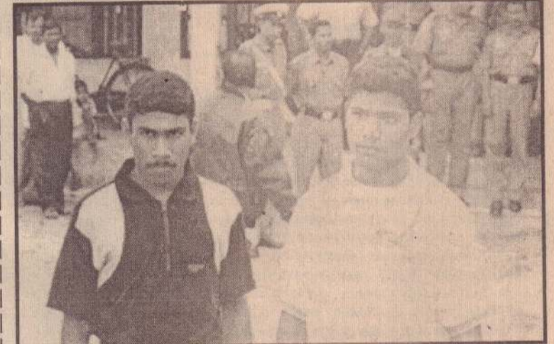
விடுவிக்கப்பட்ட புலி உறுப்பினர்கள் இருவரும் நீதிமன்றத்திலிருந்து வெளியேறும் காட்சி.

இந்நிலையில் கடந்த 25 ஆம் திகதியில் திருமலை விலகம் விகாரைப்பகுதியில் வைத்து 7 இராணுவத்தினரை புலிகள் கைது செய்தனர். அவர்களில் ஒருவர் பின்னர் மனி (16ஆம் பக்கம் பார்க்க)