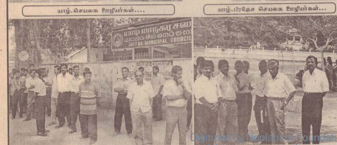
மாநகர சபை ஊழியர்கள்...