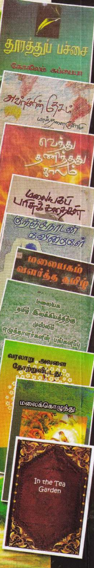
மத்திய மாகாண விவசாய, சிறிய நீர்பாசன, விலங்கு உற்பத்தி மற்றும் அபிவிருத்தி, கமநல அபிவிருத்தி நன்னீர் மீன்பிடி, இந்து கலாசாரம், தமிழ்க் கல்வி Digitized by Noolaham Foundation. தோட்டமலையகப் பாசுக்கொண்டி அமைச்சு