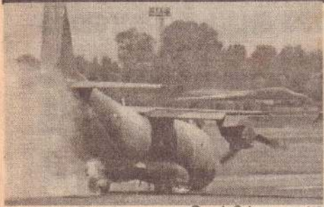
மெட்ரிட், ஓக. 22

ஸ்பெயின் தலைநகரான மெட்ரிட்டில் உள்ள பரூஸ் விமானநிலையம் ஓடு தரையில் இடம் பெற்ற விமான விபத்தில் இறந்தவர்களில் எண்ணிக்கை 153 ஆக உயர்ந்துள்ளது. இதில் 19 பேர் படுகாயங்களுடன் உயிர் தப்பியுள்ளனர் என, ஸ்பெயின் அரசு தெரிவித்தது.